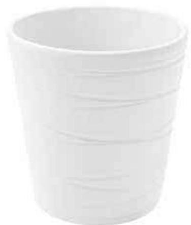
KE7-D130-BI conf. 9 pz pallet 864 pz h mm. 140 - Ø 130 interno h mm. 135 - Ø 120