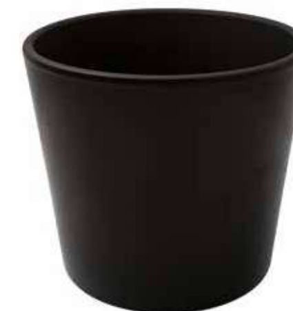
KE8-D280-NE conf. 1 pz pallet 108 pz h mm. 250 - Ø 280 interno h mm. 230 - Ø 250