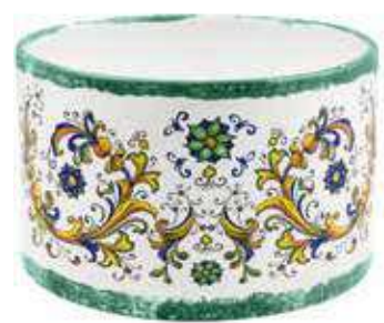
CD-26-VE conf. 1 pz h mm. 170 - Ø 260 interno h mm. 155 - Ø 245