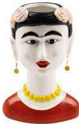
VDE-57 conf. 1 pz master 8 pz h mm. 220 x 150 x 120 interno Ø 62