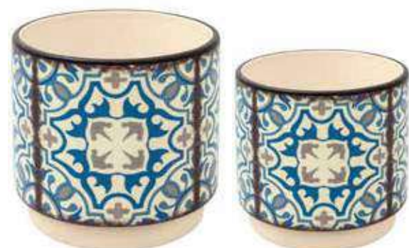
ML-39SET conf. 6 set master 24 set h mm. 125 - Ø 125 - h 100 - Ø 100 interno h mm. 115 - Ø 115 - h 90 - Ø 90