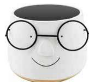
VDE-49B conf. 6 pz master 12 pz h mm. 130 - Ø 155 interno h mm. 115 - Ø 110