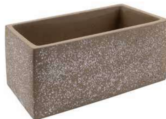
RC-06 conf. 4 pz h mm. 132 x 140 x 270 interno h mm. 120 x 120 x 250