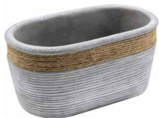
RC-03 conf. 6 pz h mm. 105 x 120 x 215 interno h mm. 98 x 100 x 205