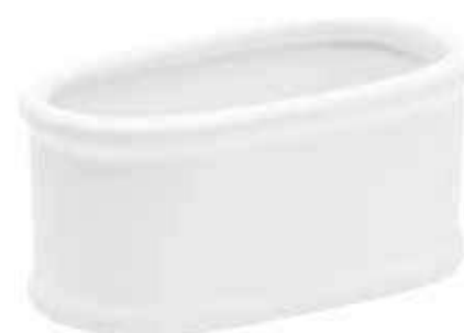
64-14 conf. 12 pz master 72 pz h mm. 65 x 135 x 75 interno h mm. 60 x 120 x 60