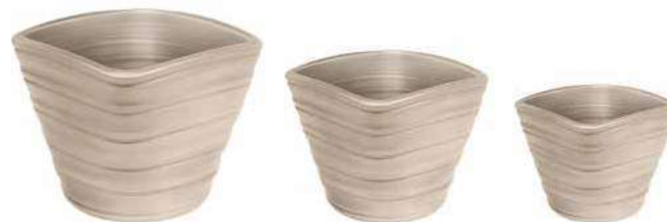
AR-08-SET-TO-PERL conf. 1 set h mm. 270 - Ø 340 - h 235 - Ø 280 - h 175 - Ø 220 interno h mm. 250 - Ø 300 - h 220 - Ø 250 - h 170 - Ø 200