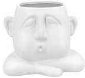
VDE-54 conf. 1 pz master 12 pz h mm. 152 x 149 x 187 interno Ø 106