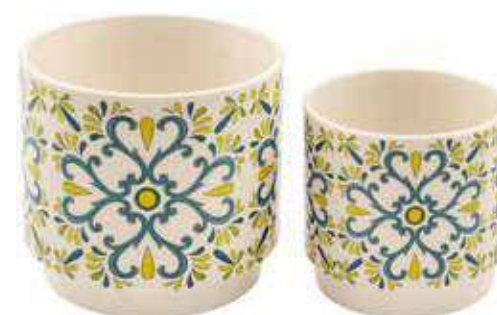
ML-25SET conf. 6 set master 24 set h mm. 125 - Ø 125 - h 100 - Ø 100 interno h mm. 115 - Ø 115 - h 90 - Ø 90