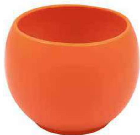
KE6-D150-AR conf. 5 pz pallet 510 pz h mm. 130 - Ø 150 interno h mm. 110 - Ø 125