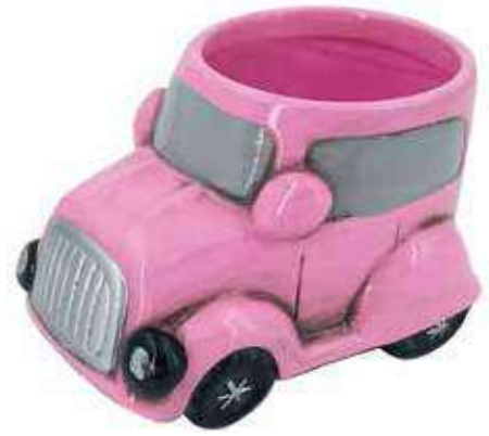
VDE-12 conf. 48 pz h mm. 70 x 130 x 80 interno h mm. 65 - Ø 75