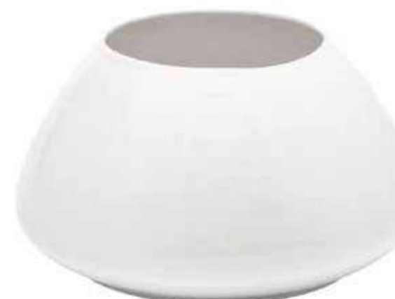
5953-2-BI conf. 2 pz h mm. 140 - Ø 250 interno h mm. 135 - Ø 130