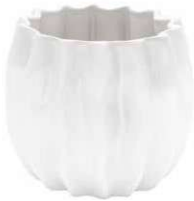
5690-1-BI conf. 4 pz h mm. 160 - Ø 180 interno h mm. 145 - Ø 120