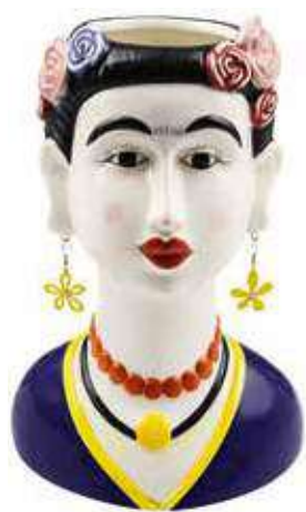
VDE-59 conf. 1 pz master 6 pz h mm. 270 x 180 x 140 interno Ø 77