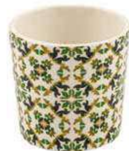
ML-18 conf. 6 pz master 108 pz h mm. 70 - Ø 70 interno h mm. 60 - Ø 60