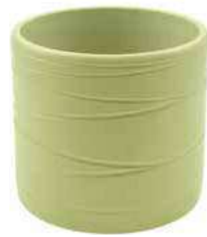
KE13-D135-VE conf. 6 pz pallet 612 pz h mm. 130 - Ø 135 interno h mm. 120 - Ø 120