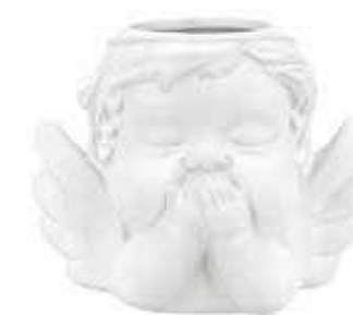
VDE-50C conf. 4 pz master 48 pz h mm. 90 x 80 x 117 interno Ø 40