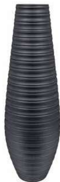
AR-06-GR-PERL conf. 1 pz h mm. 800 - Ø 240 interno h mm. 785 - Ø 135