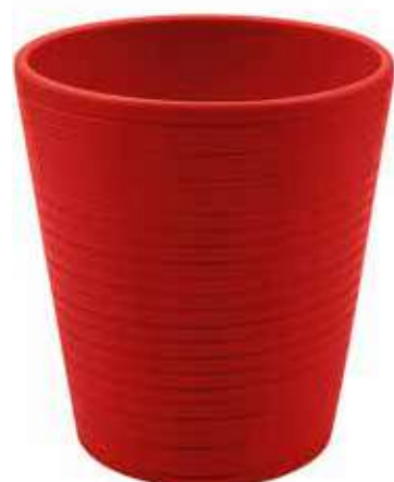
KE14-D130-RO conf. 9 pz pallet 864 pz h mm. 140 - Ø 130 interno h mm. 135 - Ø 123