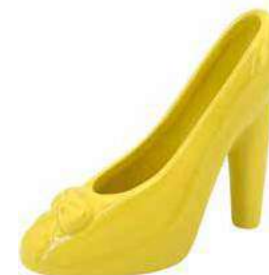
VDE-21 conf. 8 pz master 32 pz h mm. 135 x 115 x 60 interno Ø 55