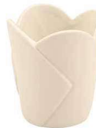
B302-5-AV conf. 12 pz h mm. 70 - Ø 88 interno h mm. 65 - Ø 82