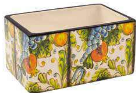
ML-34 conf. 6 pz master 24 pz h mm. 90 x 90 x 145 interno h mm. 80 x 80 x 135