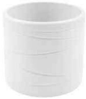
KE13-D135-BI conf. 6 pz pallet 612 pz h mm. 130 - Ø 135 interno h mm. 120 - Ø 120