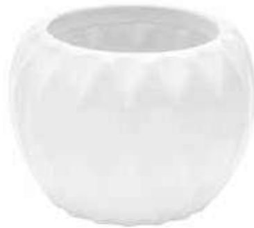
6354-2-BI conf. 6 pz h mm. 130 - Ø 170 interno h mm. 120 - Ø 115