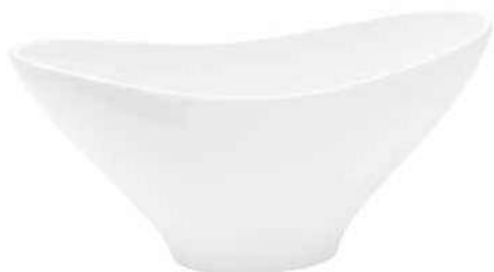
5210-2-BI conf. 2 pz h mm. 145 x 350 x 160 interno h mm. 140 x 330 x 150