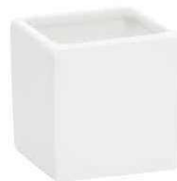
6558-BI conf. 8 pz h mm. 125 x 125 x 125 interno h mm. 115 x 105 x 105