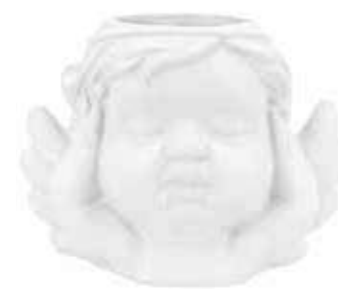
VDE-50B conf. 4 pz master 48 pz h mm. 85 x 75 x 120 interno Ø 40