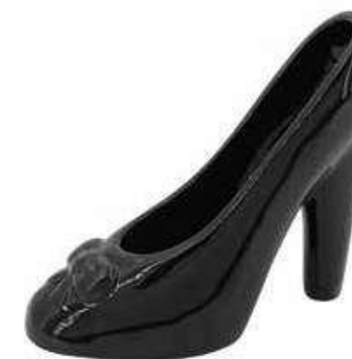
VDE-23 conf. 8 pz master 32 pz h mm. 135 x 115 x 60 interno Ø 55