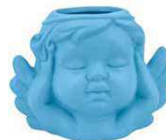
VDE-50B-CE conf. 4 pz master 48 pz h mm. 85 x 75 x 120 interno Ø 40