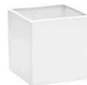
3363-2-BI conf. 6 pz h mm. 165 x 165 x 165 interno h mm. 150 x 145 x 145