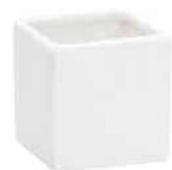
63-7 conf. 12 pz master 72 pz h mm. 75 x 75 x 75 interno h mm. 68 x 67 x 67