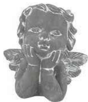
VDE-51A conf. 1 pz master 8 pz h mm. 195 x 130 x 195 interno h mm. 75 - Ø 80