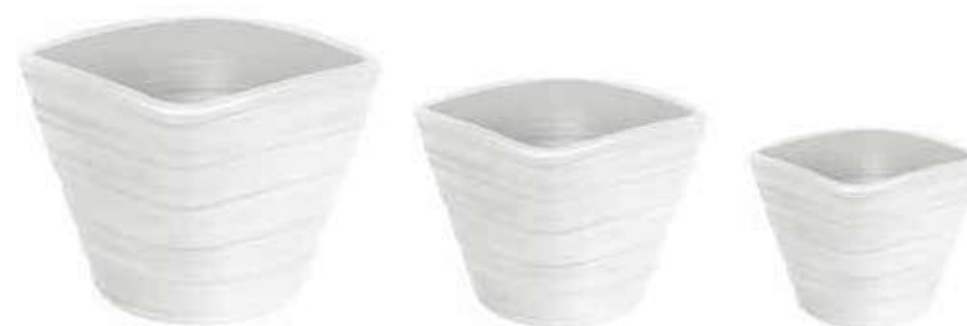
AR-08-SET-BI conf. 1 set h mm. 270 - Ø 340 - h 235 - Ø 280 - h 175 - Ø 220 interno h mm. 250 - Ø 300 - h 220 - Ø 250 - h 170 - Ø 200