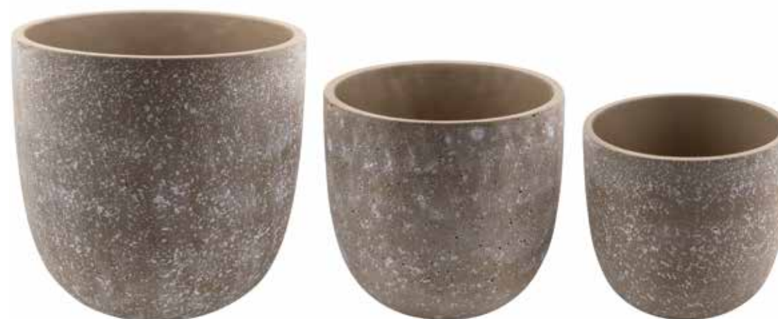
RC-08SET conf. 1 set h mm. 310 - Ø 330 - h 245 - Ø 265 - h 205 - Ø 225 interno h mm. 290 - Ø 300 - h 230 - Ø 245 - h 190 - Ø 200