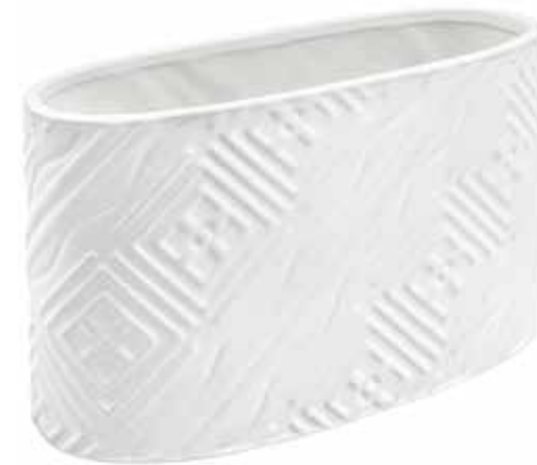
VDE-06 conf. 18 pz h mm. 130 x 115 x 220 interno h mm. 125 x 110 x 215