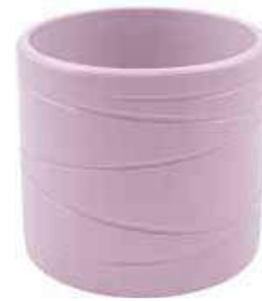
KE13-D135-LI conf. 6 pz pallet 612 pz h mm. 130 - Ø 135 interno h mm. 120 - Ø 120