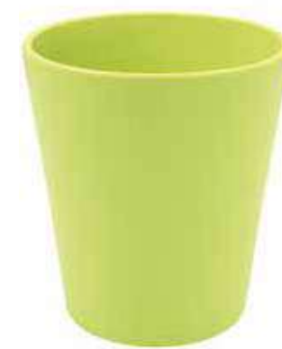
KE5-D100-VE conf. 9 pz pallet 1008 pz h mm. 130 - Ø 105 interno h mm. 95 - Ø 95