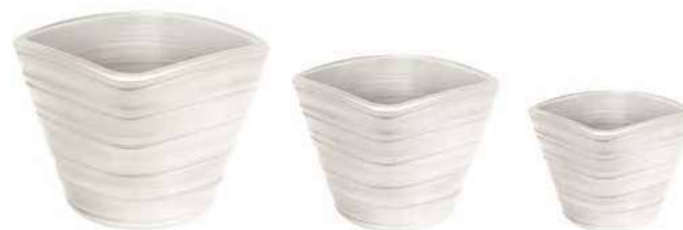
AR-08-SET-BI-PERL conf. 1 set h mm. 270 - Ø 340 - h 235 - Ø 280 - h 175 - Ø 220 interno h mm. 250 - Ø 300 - h 220 - Ø 250 - h 170 - Ø 200