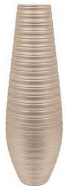
AR-06-TO-PERL conf. 1 pz h mm. 800 - Ø 240 interno h mm. 785 - Ø 135