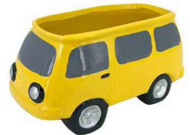
VDE-09 conf. 24 pz h mm. 98 x 205 x 102 interno h mm. 90 - Ø 95