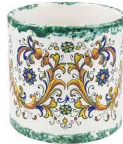
CD-15-VE conf. 1 pz h mm. 160 - Ø 150 interno h mm. 143 - Ø 140