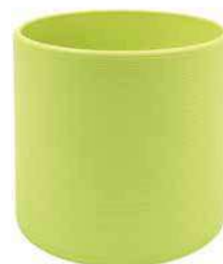
KE1-D135-VE conf. 6 pz pallet 612 pz h mm. 130 - Ø 135 interno h mm. 115 - Ø 120