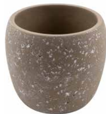
RC-05 conf. 12 pz pallet 480 pz h mm. 132 - Ø 142 interno h mm. 120 - Ø 115