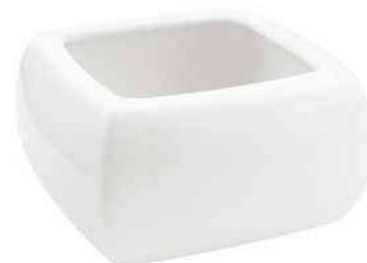
6559-BI conf. 8 pz h mm. 80 x 155 x 155 interno h mm. 65 x 100 x 100