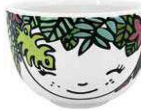
VDE-38 conf. 24 pz master 96 pz h mm. 50 - Ø 75 interno Ø 65