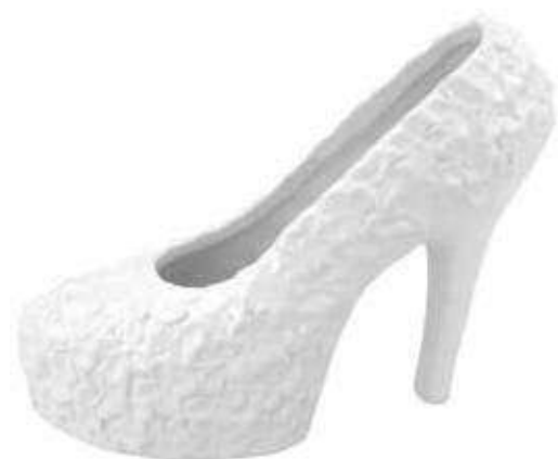
VDE-24 conf. 1 pz master 16 pz h mm. 147 x 195 x 80 interno Ø 75