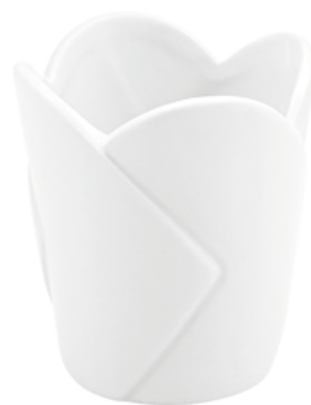
B302-5-BI conf. 12 pz h mm. 70 - Ø 88 interno h mm. 65 - Ø 82