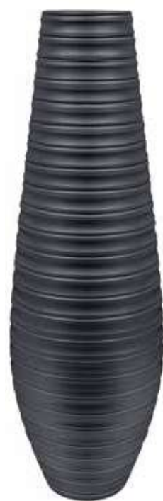
AR-07-GR-PERL conf. 1 pz h mm. 1200 - Ø 280 interno h mm. 1185 - Ø 150