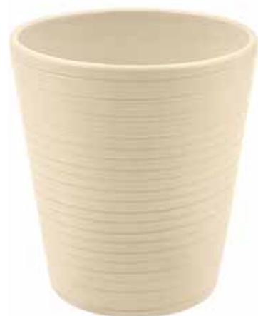
KE14-D130-AV conf. 9 pz pallet 864 pz h mm. 140 - Ø 130 interno h mm. 135 - Ø 123