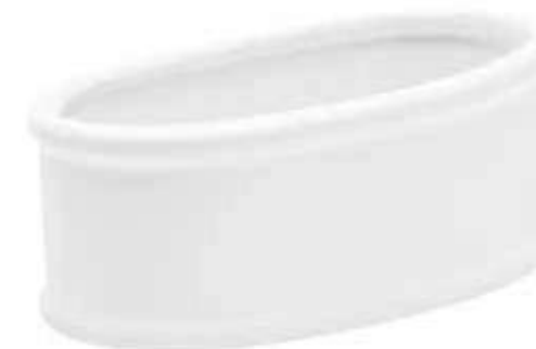
64-20 conf. 12 pz master 72 pz h mm. 65 x 200 x 75 interno h mm. 60 x 185 x 60