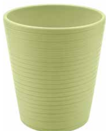
KE14-D130-VE conf. 9 pz pallet 864 pz h mm. 140 - Ø 130 interno h mm. 135 - Ø 123