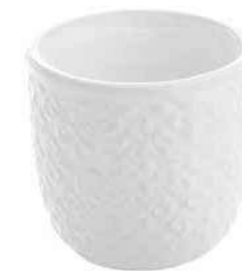
D812-5 conf. 12 pz master 144 pz h mm. 74 - Ø 76 interno h mm. 58 - Ø 65