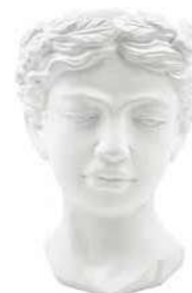
VDE-35B conf. 1 pz master 4 pz h mm. 270 x 220 x 200 interno h mm. 105 - Ø 105