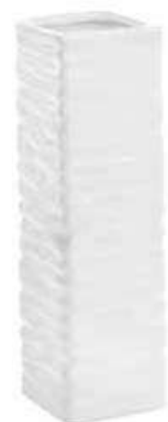
3130 conf. 6 pz master 72 pz h mm. 180 x 50 x 50 interno h mm. 162 x 45 x 45