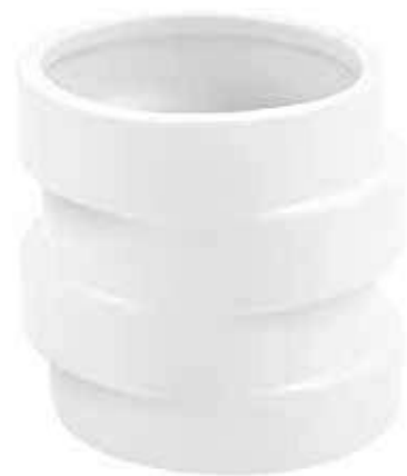
N352-5-BI conf. 12 pz h mm. 82 - Ø 73 interno h mm. 77 - Ø 68