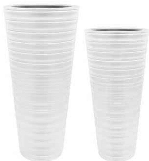
AR-02-BI conf. 1 pz h mm. 915 - Ø 360 interno h mm. 900 - Ø 280