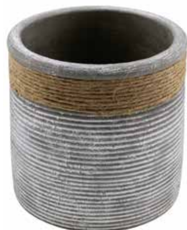
RC-01 conf. 12 pz pallet 560 pz h mm. 120 - Ø 135 interno h mm. 110 - Ø 120