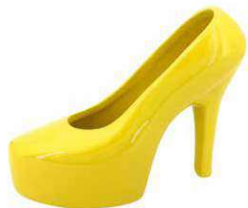
VDE-27 conf. 1 pz master 16 pz h mm. 147 x 195 x 80 interno Ø 75