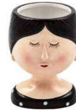
VDE-44 conf. 12 pz master 72 pz h mm. 100 - Ø 75 interno Ø 45