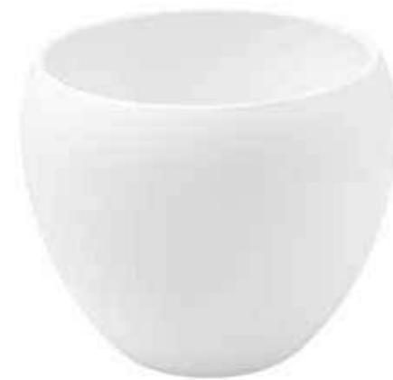
KE9-D220-BI conf. 1 pz pallet 165 pz h mm. 180 - Ø 220 interno h mm. 160 - Ø 180