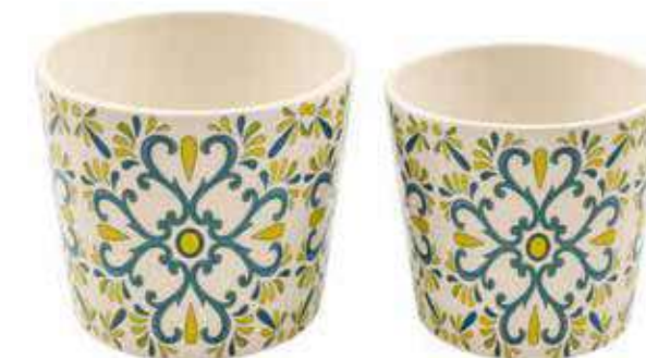
ML-24SET conf. 6 set master 18 set h mm. 125 - Ø 145 - h 110 - Ø 120 interno h mm. 120 - Ø 140 - h 105 - Ø 115