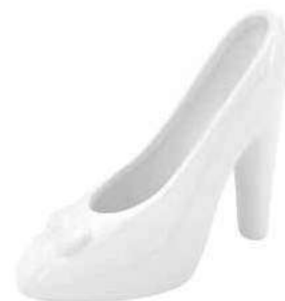
VDE-19 conf. 8 pz master 32 pz h mm. 135 x 115 x 60 interno Ø 55