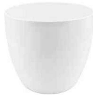
KC920-033-BI conf. 1 pz h mm. 310 - Ø 330 interno h mm. 290 - Ø 315