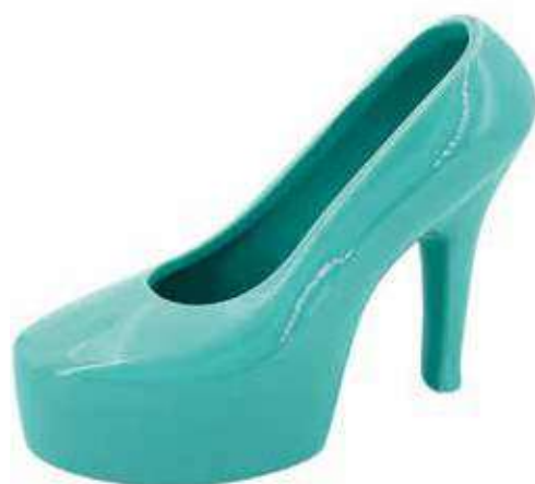
VDE-26 conf. 1 pz master 16 pz h mm. 147 x 195 x 80 interno Ø 75