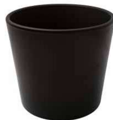
KE8-D240-NE conf. 1 pz pallet 150 pz h mm. 220 - Ø 240 interno h mm. 200 - Ø 220