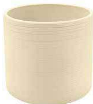
KE1-D135-AV conf. 6 pz pallet 612 pz h mm. 130 - Ø 135 interno h mm. 115 - Ø 120