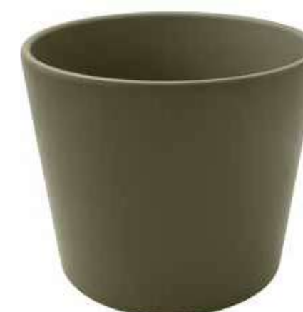
KE8-D280-OLIVA conf. 1 pz pallet 108 pz h mm. 250 - Ø 280 interno h mm. 230 - Ø 250