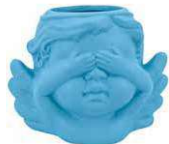
VDE-50A-CE conf. 4 pz master 48 pz h mm. 85 x 75 x 117 interno Ø 40