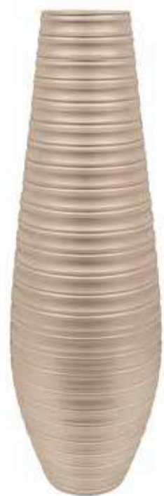
AR-07-TO-PERL conf. 1 pz h mm. 1200 - Ø 280 interno h mm. 1185 - Ø 150