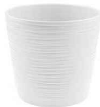
KE16-D210-BI conf. 1 pz pallet 264 pz h mm. 190 - Ø 210 interno h mm. 180 - Ø 170