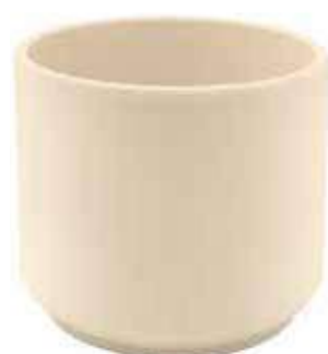
KE12-D150-AV conf. 5 pz pallet 480 pz h mm. 120 - Ø 150 interno h mm. 110 - Ø 135