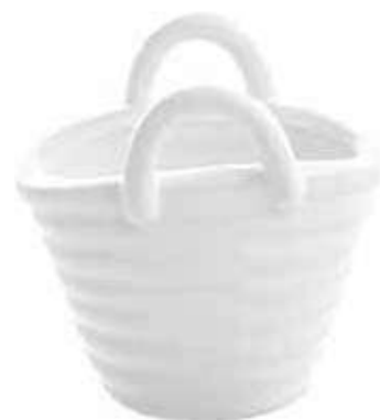
2036-3 conf. 12 pz master 120 pz h mm. 80 x 65 x 85 interno h mm. 46 x 35 x 75