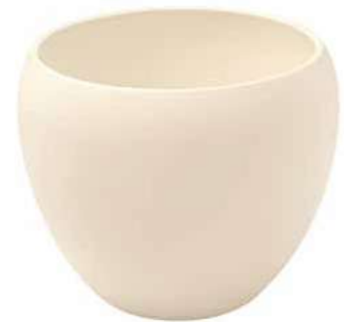
KE9-D270-AV conf. 1 pz pallet 108 pz h mm. 230 - Ø 270 interno h mm. 210 - Ø 230