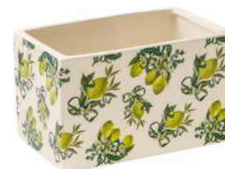
ML-20 conf. 6 pz master 24 pz h mm. 90 x 90 x 145 interno h mm. 80 x 80 x 135