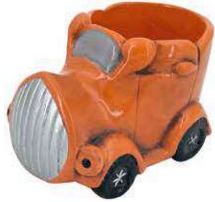
VDE-13 conf. 48 pz h mm. 70 x 130 x 80 interno h mm. 65 - Ø 75