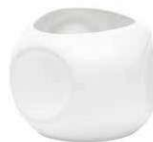
5910-1-BI conf. 4 pz h mm. 130 - Ø 180 interno h mm. 125 - Ø 125