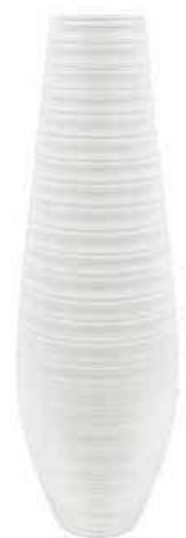
AR-06-BI conf. 1 pz h mm. 800 - Ø 240 interno h mm. 785 - Ø 135