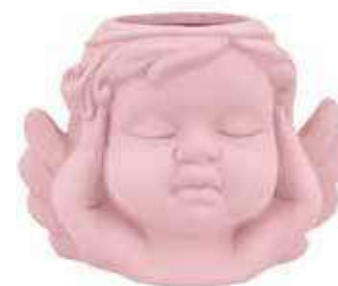
VDE-50B-RS conf. 4 pz master 48 pz h mm. 85 x 75 x 120 interno Ø 40