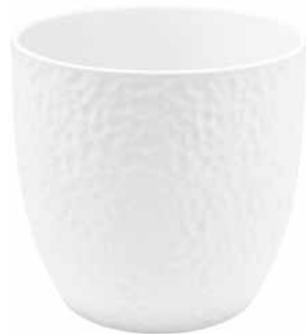
KC049-027-BI conf. 1 pz h mm. 260 - Ø 270 interno h mm. 255 - Ø 260