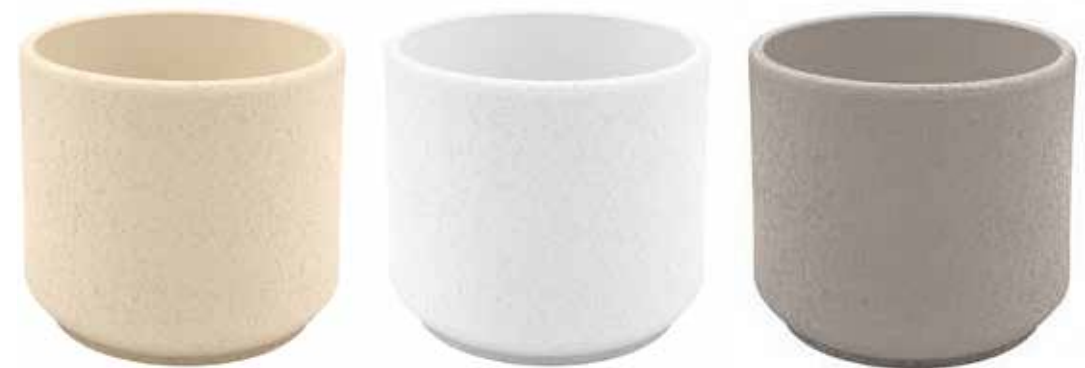
KE10-COL3 conf. 1 set da 12 pz pallet 168 set h mm. 95 - Ø 100 interno h mm. 80 - Ø 85