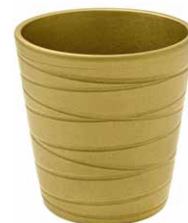
KE7-D130-ORO conf. 9 pz pallet 864 pz h mm. 140 - Ø 130 interno h mm. 135 - Ø 120