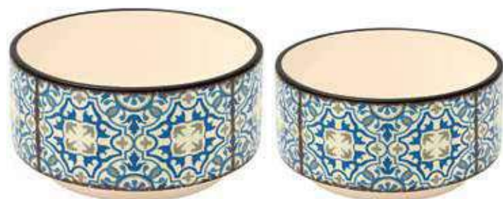
ML-35SET conf. 4 set master 16 set h mm. 95 - Ø 185 - h 85 - Ø 160 interno h mm. 85 - Ø 170 - h 80 - Ø 150