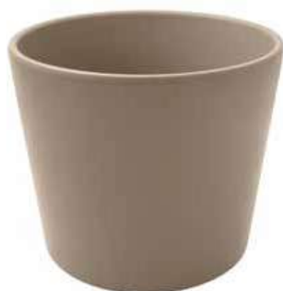
KE8-D240-FANGO conf. 1 pz pallet 150 pz h mm. 220 - Ø 240 interno h mm. 200 - Ø 220