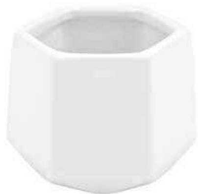
P042-5-BI conf. 12 pz h mm. 70 - Ø 84 interno h mm. 65 - Ø 80