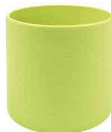
KE1-D150-VE cconf. 5 pz pallet 480 pz h mm. 140 - Ø 155 interno h mm. 125 - Ø 140