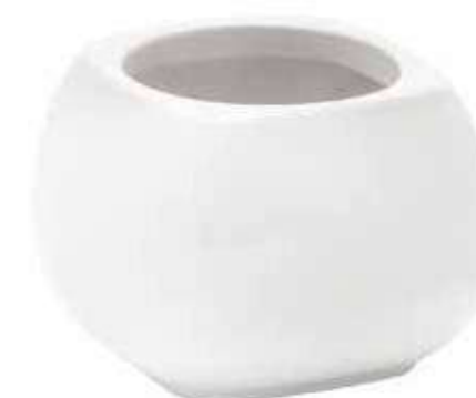
6426-BI conf. 4 pz h mm. 130 - Ø 180 interno h mm. 120 - Ø 120