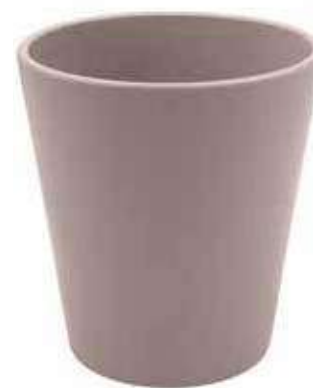
KE5-D100-TO conf. 9 pz pallet 1008 pz h mm. 130 - Ø 105 interno h mm. 95 - Ø 95