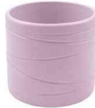
KE13-D150-LI conf. 5 pz pallet 480 pz h mm. 140 - Ø 155 interno h mm. 125 - Ø 140