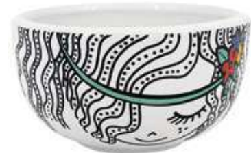
VDE-43 conf. 24 pz master 48 pz h mm. 60 - Ø 110 interno Ø 98