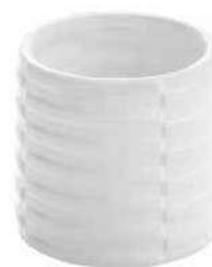
C952-5 conf. 12 pz master 144 pz h mm. 70 - Ø 75 interno h mm. 55 - Ø 60