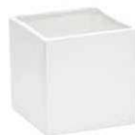
3363-1-BI conf. 6 pz h mm. 135 x 135 x 135 interno h mm. 125 x 125 x 125