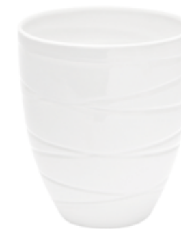
5326-1-BI conf. 3 pz h mm. 200 - Ø 180 interno h mm. 195 - Ø 165