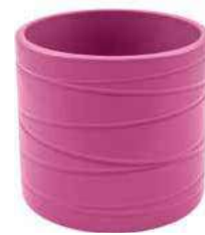
KE13-D135-FC conf. 6 pz pallet 612 pz h mm. 130 - Ø 135 interno h mm. 120 - Ø 120