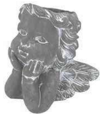
VDE-51B conf. 1 pz master 4 pz h mm. 245 x 145 x 260 interno h mm. 90- Ø 75