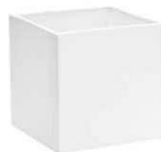
3363-3-BI conf. 4 pz h mm. 205 x 205 x 205 interno h mm. 190 x 190 x 190