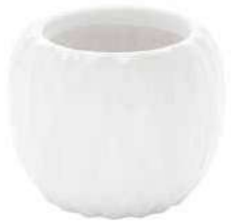
6354-1-BI conf. 6 pz h mm. 110 - Ø 140 interno h mm. 105 - Ø 90