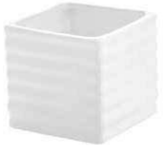
2022-0 conf. 24 pz master 144 pz h mm. 60 x 60 x 60 interno h mm. 50 x 50 x 50