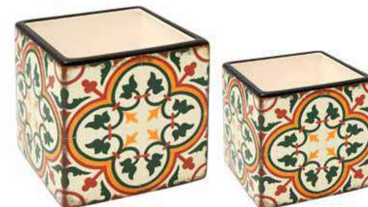
ML-37SET conf. 6 set master 18 set h mm. 135 x 135 x 135 - h 100 x 100 x 100 interno h mm. 125 x 125 x 125 - h 90 x 90 x 90