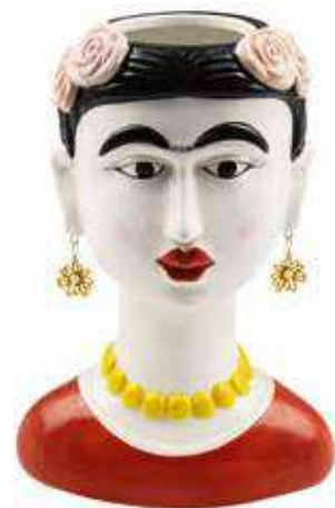
VDE-58 conf. 1 pz master 6 pz h mm. 270 x 190 x 150 interno Ø 67