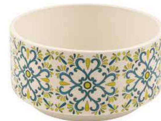
ML-26 conf. 4 pz master 8 pz h mm. 145 - Ø 230 interno h mm. 135 - Ø 215