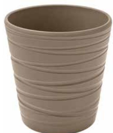
KE7-D130-FANGO conf. 9 pz pallet 864 pz h mm. 140 - Ø 130 interno h mm. 135 - Ø 120