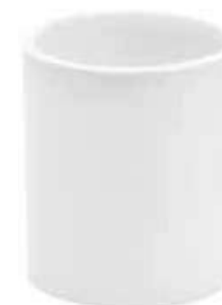
61-H90 conf. 12 pz master 144 pz h mm. 90 - Ø 80 interno h mm. 80 - Ø 66