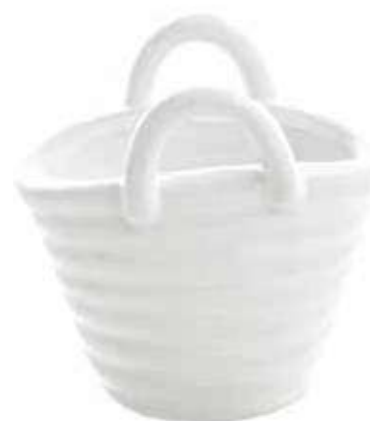
2036-2 conf. 9 pz master 90 pz h mm. 95 x 75 x 105 interno h mm. 60 x 45 x 90