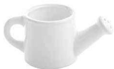
18085 conf. 12 pz master 120 pz h mm. 60 x 70 x 140 interno h mm. 47 - Ø 56