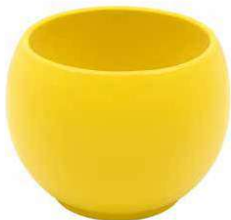
KE6-D150-GL conf. 5 pz pallet 510 pz h mm. 130 - Ø 150 interno h mm. 110 - Ø 125