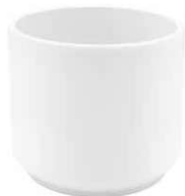
KE12-D190-BI conf. 4 pz pallet 288 pz h mm. 170 - Ø 190 interno h mm. 160 - Ø 175