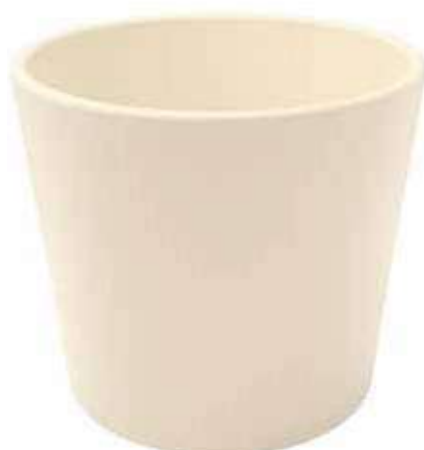
KE8-D280-AV conf. 1 pz pallet 108 pz h mm. 250 - Ø 280 interno h mm. 230 - Ø 250