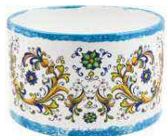
CD-26-BL conf. 1 pz h mm. 170 - Ø 260 interno h mm. 155 - Ø 245