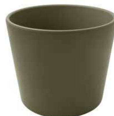
KE8-D240-OLIVA conf. 1 pz pallet 150 pz h mm. 220 - Ø 240 interno h mm. 200 - Ø 220