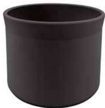
KC525-022-NE conf. 1 pz h mm. 190 - Ø 220 interno h mm. 175 - Ø 200