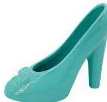
VDE-20 conf. 8 pz master 32 pz h mm. 135 x 115 x 60 interno Ø 55