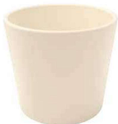
KE8-D240-AV conf. 1 pz pallet 150 pz h mm. 220 - Ø 240 interno h mm. 200 - Ø 220