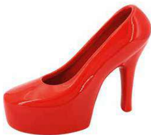
VDE-28 conf. 1 pz master 16 pz h mm. 147 x 195 x 80 interno Ø 75