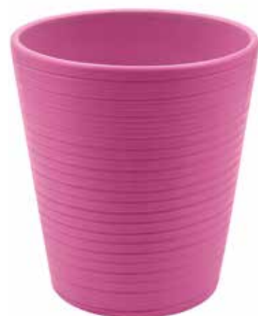
KE14-D130-FC conf. 9 pz pallet 864 pz h mm. 140 - Ø 130 interno h mm. 135 - Ø 123