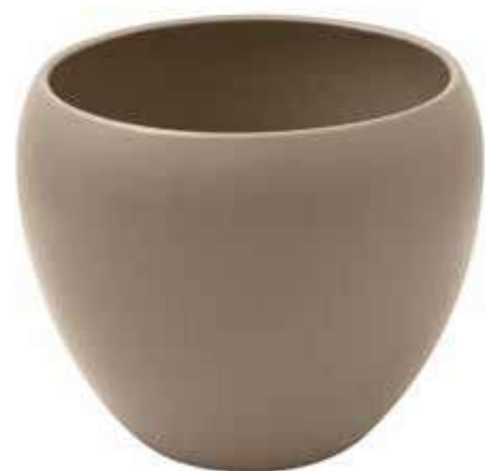
KE9-D220-FANGO conf. 1 pz pallet 165 pz h mm. 180 - Ø 220 interno h mm. 160 - Ø 180