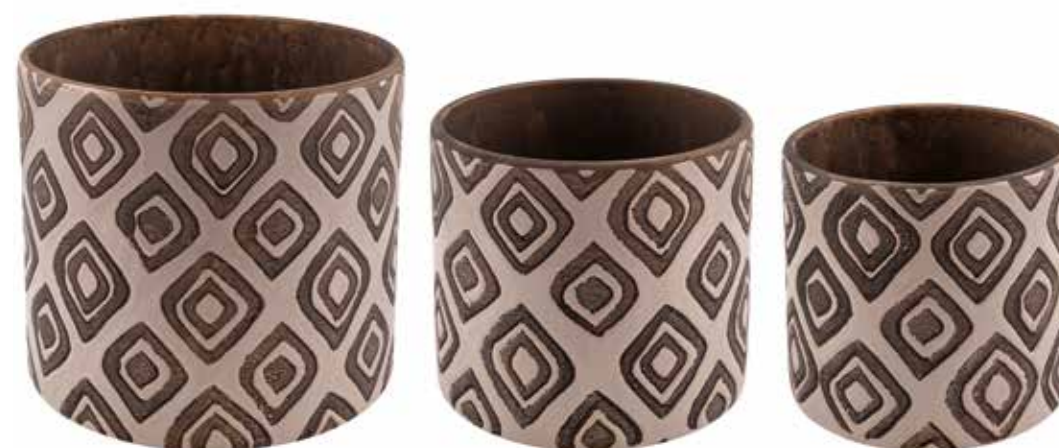
KE15-TO-SET conf. 4 set pallet 192 set h mm. 172 - Ø 190 - h 140 - Ø 155 - h 130 - Ø 140 interno h mm. 160 - Ø 170 - h 125 - Ø 140 - h 115 - Ø 123