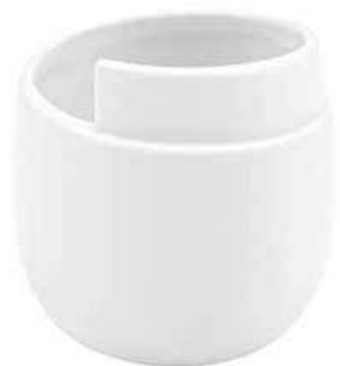
Q432-5-BI conf. 12 pz h mm. 70 - Ø 88 interno h mm. 65 - Ø 80