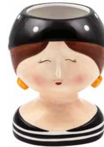
VDE-46 conf. 1 pz master 12 pz h mm. 190 - Ø 140 interno Ø 83