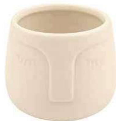
A832-5-AV conf. 12 pz h mm. 70 - Ø 84 interno h mm. 65 - Ø 80