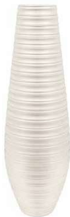
AR-07-BI-PERL conf. 1 pz h mm. 1200 - Ø 280 interno h mm. 1185 - Ø 150