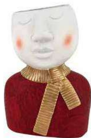
VDE-31 conf. 1 pz master 4 pz h mm. 275 x 140 x 200 interno h mm. 100- Ø 95