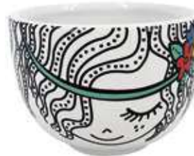
VDE-39 conf. 24 pz master 96 pz h mm. 50 - Ø 75 interno Ø 65