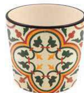
ML-41 conf. 6 pz master 108 pz h mm. 70 - Ø 70 interno h mm. 60 - Ø 60