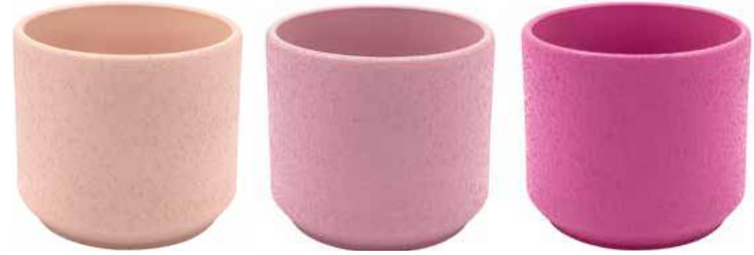
KE10-COL1 conf. 1 set da 12 pz pallet 168 set h mm. 95 - Ø 100 interno h mm. 80 - Ø 85