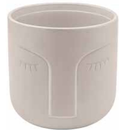
VS-01-TO conf. 1 pz master 12 pz pallet 652 pz h mm. 125 - Ø 125 interno Ø 114