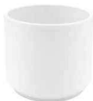
KE12-D150-BI conf. 5 pz pallet 480 pz h mm. 120 - Ø 150 interno h mm. 110 - Ø 135