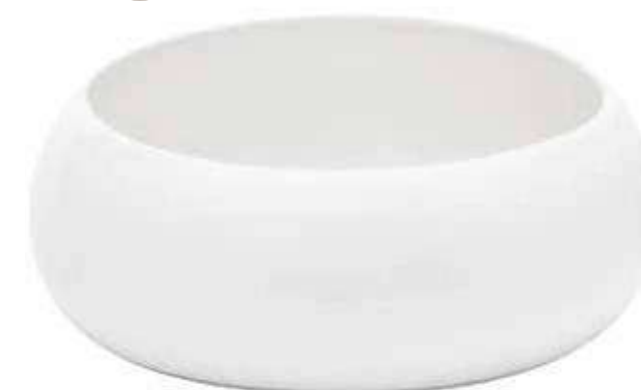
6556-BI conf. 8 pz h mm. 70 - Ø 200 interno h mm. 60 - Ø 160