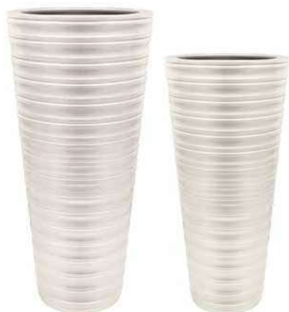
AR-02-BI-PERL conf. 1 pz h mm. 915 - Ø 360 interno h mm. 900 - Ø 280