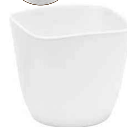
6569-BI conf. 4 pz h mm. 130 x 145 x 145 interno h mm. 130 x 130 x 130