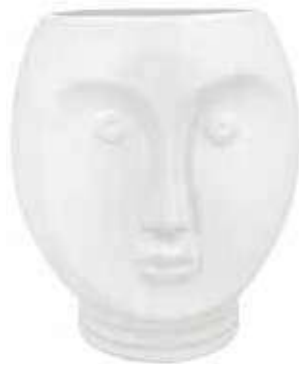
VDE-55 conf. 1 pz master 12 pz h mm. 182 x 154 x 160 interno Ø 110