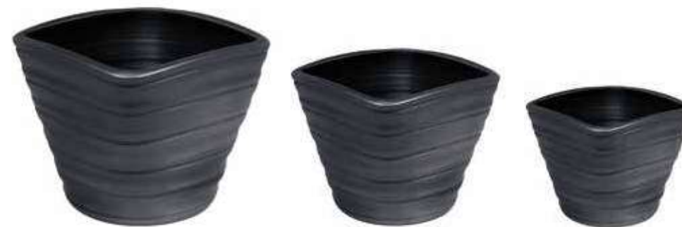
AR-08-SET-GR-PERL conf. 1 set h mm. 270 - Ø 340 - h 235 - Ø 280 - h 175 - Ø 220 interno h mm. 250 - Ø 300 - h 220 - Ø 250 - h 170 - Ø 200