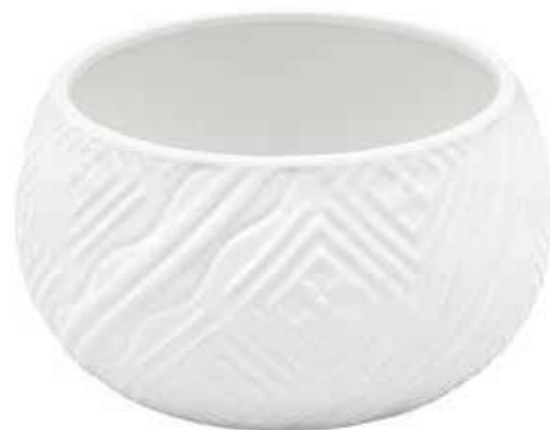
VDE-03 conf. 12 pz h mm. 100 - Ø 200 interno h mm. 95 - Ø 190