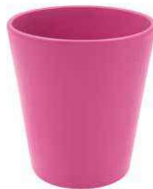
KE5-D100-FC conf. 9 pz pallet 1008 pz h mm. 130 - Ø 105 interno h mm. 95 - Ø 95