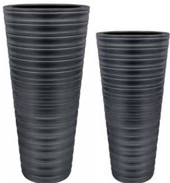
AR-02-GR-PERL conf. 1 pz h mm. 915 - Ø 360 interno h mm. 900 - Ø 280