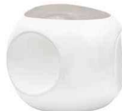
5910-3-BI conf. 1 pz h mm. 220 - Ø 260 interno h mm. 195 - Ø 175