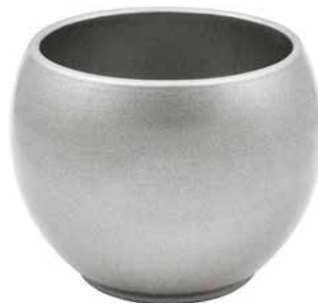
KE6-D150-ARG conf. 5 pz pallet 510 pz h mm. 130 - Ø 150 interno h mm. 110 - Ø 125