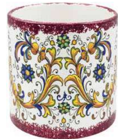
CD-15-PR conf. 1 pz h mm. 160 - Ø 150 interno h mm. 143 - Ø 140