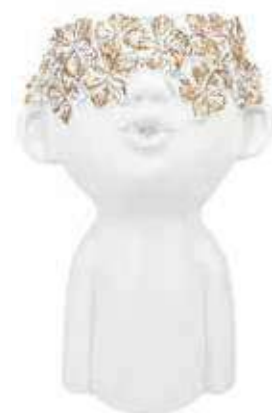
VDE-48B conf. 1 pz master 4 pz h mm. 255 x 125 x 175 interno h mm. 105- Ø 100