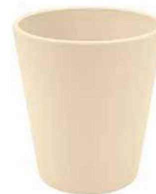
KE5-D100-AV conf. 9 pz pallet 1008 pz h mm. 130 - Ø 105 interno h mm. 95 - Ø 95