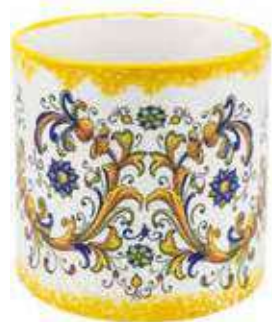
CD-18-GL conf. 1 pz h mm. 195 - Ø 180 interno h mm. 180 - Ø 165