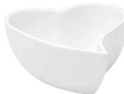
CR-03 conf. 6 pz master 24 pz h mm. 60 x 140 x 140 interno h mm. 50 x 130 x 130