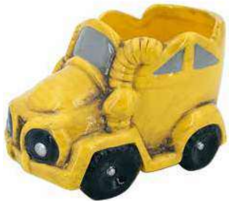
VDE-14 conf. 48 pz h mm. 70 x 130 x 80 interno h mm. 65 - Ø 75