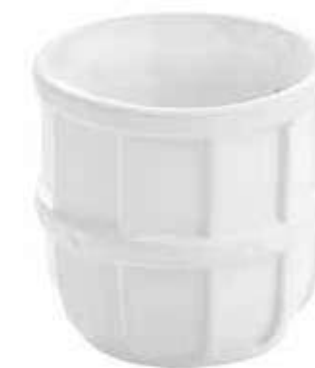
F422-5 conf. 12 pz master 144 pz h mm. 70 - Ø 75 interno h mm. 58 - Ø 60