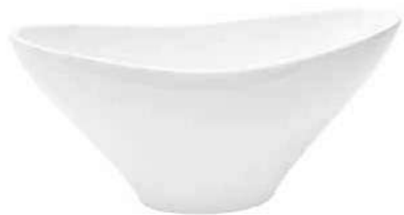
5210-1-BI conf. 4 pz h mm. 115 x 260 x 125 interno h mm. 105 x 255 x 120