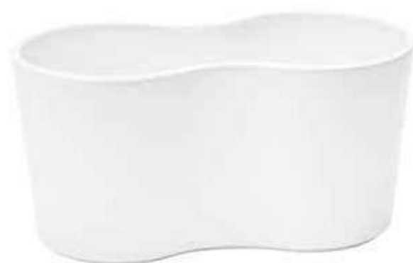
5181-1-BI conf. 4 pz h mm. 130 x 260 x 135 interno h mm. 120 x 245 x 125