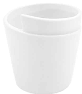
Q042-5-BI conf. 12 pz h mm. 70 - Ø 88 interno h mm. 65 - Ø 80