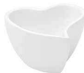
CR-01 conf. 20 pz master 80 pz h mm. 45 x 73 x 73 interno h mm. 35 x 63 x 63