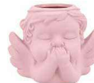
VDE-50C-RS conf. 4 pz master 48 pz h mm. 90 x 80 x 117 interno Ø 40