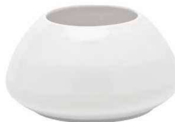
5953-1-BI conf. 4 pz h mm. 120 - Ø 225 interno h mm. 115 - Ø 120