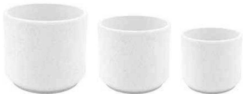
KE11-BI-SET conf. 4 set pallet 192 set h mm. 160 - Ø 190 - h 120 - Ø 150 - h 100 - Ø 120 interno h mm. 150 - Ø 175 - h 110 - Ø 140 - h 95 - Ø 105