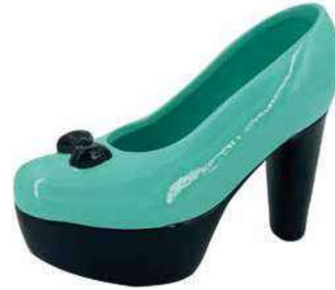
VDE-11 conf. 16 pz h mm. 147 x 195 x 80 interno Ø 75