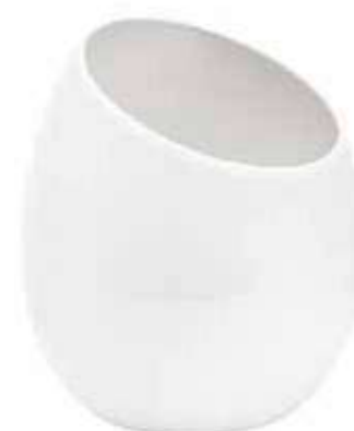
5639-2-BI conf. 6 pz h mm. 220 - Ø 170 interno h mm. 140 - Ø 150