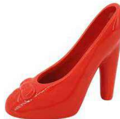
VDE-22 conf. 8 pz master 32 pz h mm. 135 x 115 x 60 interno Ø 55