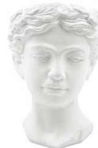
VDE-35C conf. 1 pz master 2 pz h mm. 330 x 280 x 260 interno h mm. 160 - Ø 170