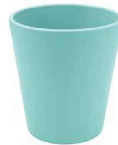
KE5-D130-CE conf. 9 pz pallet 864 pz h mm. 140 - Ø 130 interno h mm. 135 - Ø 118