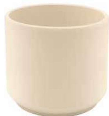
KE12-D190-AV conf. 4 pz pallet 288 pz h mm. 170 - Ø 190 interno h mm. 160 - Ø 175