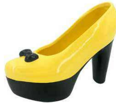
VDE-10 conf. 16 pz h mm. 147 x 195 x 80 interno Ø 75