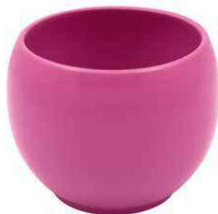
KE6-D150-FC conf. 5 pz pallet 510 pz h mm. 130 - Ø 150 interno h mm. 110 - Ø 125