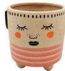
VDE-34 conf. 6 pz master 18 pz h mm. 120 x 112 x 125 interno Ø 92