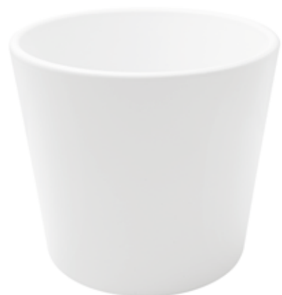
KE8-D240-BI conf. 1 pz pallet 150 pz h mm. 220 - Ø 240 interno h mm. 200 - Ø 220