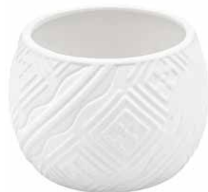
VDE-02 conf. 18 pz h mm. 100 - Ø 150 interno h mm. 95 - Ø 140