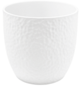
KC049-016-BI conf. 1 pz h mm. 150 - Ø 160 interno h mm. 145 - Ø 150