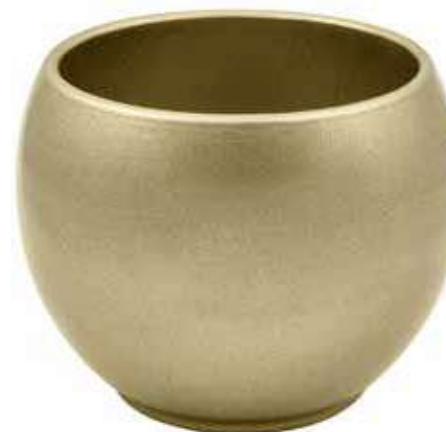
KE6-D150-CHA conf. 5 pz pallet 510 pz h mm. 130 - Ø 150 interno h mm. 110 - Ø 125