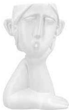
VDE-52 conf. 1 pz master 12 pz h mm. 262 x 112 x 174 interno Ø 90