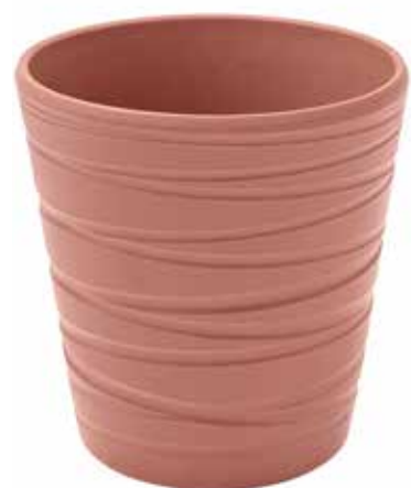
KE7-D130-RA conf. 9 pz pallet 864 pz h mm. 140 - Ø 130 interno h mm. 135 - Ø 120