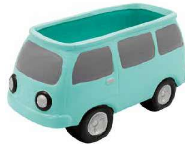
VDE-08 conf. 24 pz h mm. 98 x 205 x 102 interno h mm. 90 - Ø 95