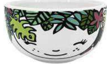
VDE-42 conf. 24 pz master 48 pz h mm. 60 - Ø 110 interno Ø 98