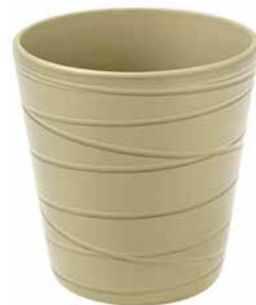
KE7-D130-SALVIA conf. 9 pz pallet 864 pz h mm. 140 - Ø 130 interno h mm. 135 - Ø 120