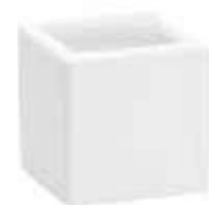
63-6 conf. 24 pz master 144 pz h mm. 60 x 60 x 60 interno h mm. 53 x 52 x 52