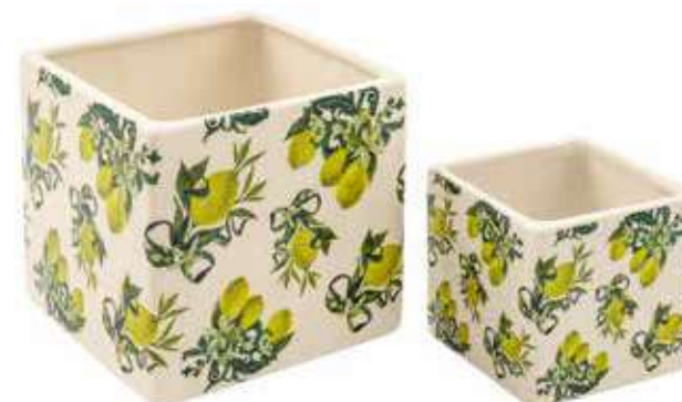
ML-13SET conf. 6 set master 24 set h mm. 120 x 120 x 120 - h 80 x 80 x 80 interno h mm. 110 x 110 x 110 - h 70 x 70 x 70