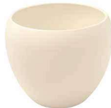
KE9-D220-AV conf. 1 pz pallet 165 pz h mm. 180 - Ø 220 interno h mm. 160 - Ø 180