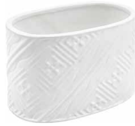
VDE-05 conf. 36 pz h mm. 100 x 100 x 155 interno h mm. 95 x 95 x 150