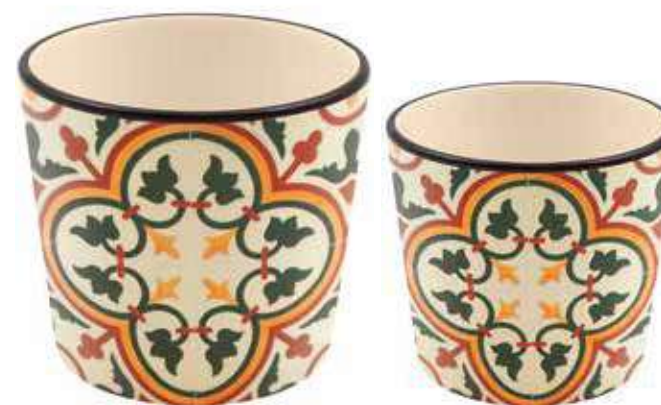
ML-38SET conf. 6 set master 18 set h mm. 125 - Ø 145 - h 110 - Ø 120 interno h mm. 120 - Ø 140 - h 105 - Ø 115