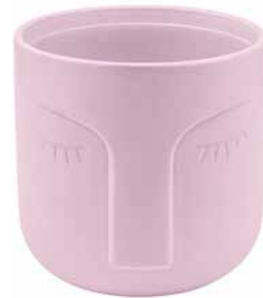
VS-01-RS conf. 1 pz master 12 pz pallet 652 pz h mm. 125 - Ø 125 interno Ø 114