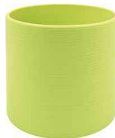
KE1-D180-VE conf. 4 pz pallet 312 pz h mm. 175 - Ø 185 interno h mm. 160 - Ø 170