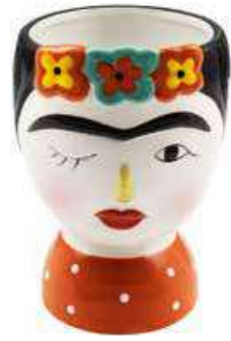
VDE-63 conf. 4 pz master 16 pz h mm. 180 x 120 x 120 interno Ø 100