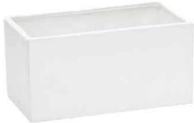
6498-BI conf. 2 pz h mm. 145 x 285 x 150 interno h mm. 130 x 240 x 120