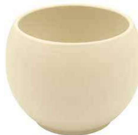
KE6-D150-AV conf. 5 pz pallet 510 pz h mm. 130 - Ø 150 interno h mm. 110 - Ø 125