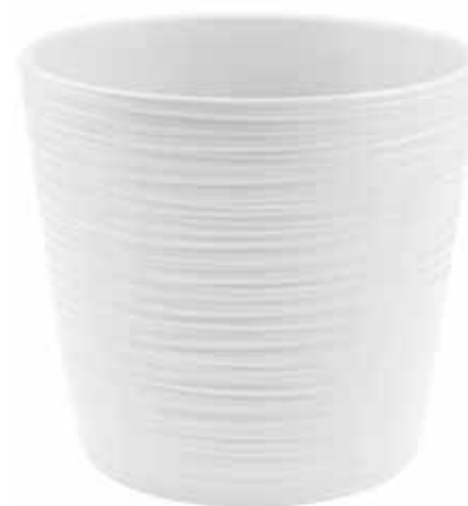
KE16-D280-BI conf. 1 pz pallet 108 pz h mm. 250 - Ø 280 interno h mm. 240 - Ø 260