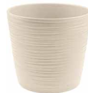
KE16-D210-AV conf. 1 pz pallet 264 pz h mm. 190 - Ø 210 interno h mm. 180 - Ø 170