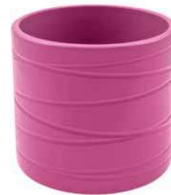
KE13-D180-FC conf. 4 pz pallet 312 pz h mm. 175 - Ø 185 interno h mm. 160 - Ø 170