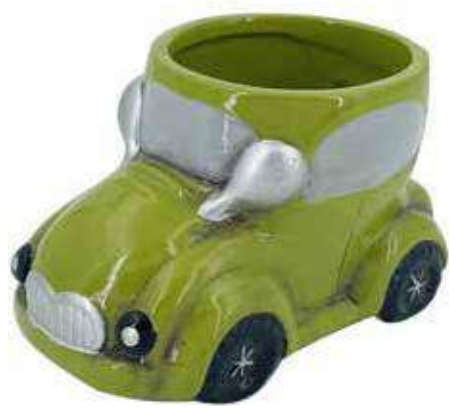
VDE-15 conf. 48 pz h mm. 70 x 130 x 80 interno h mm. 65 - Ø 75