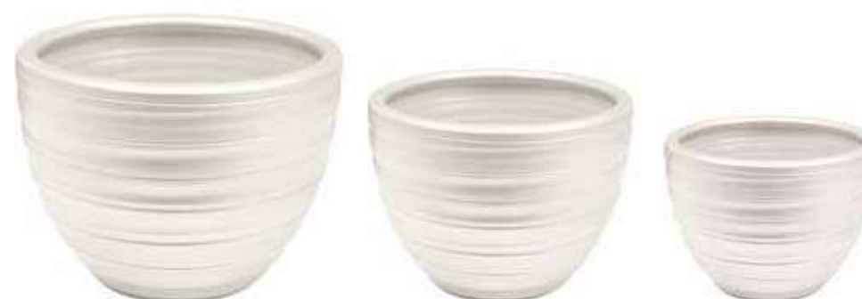
AR-03-SET-BI-PERL conf. 1 set h mm. 400 - Ø 500 - h 310 - Ø 420 - h 260 - Ø 340 interno h mm. 320 - Ø 455 - h 290 - Ø 360 - h 250 - Ø 290