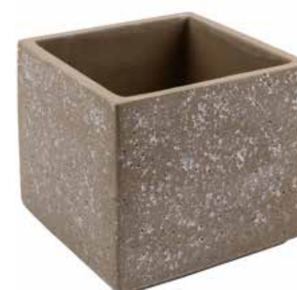
RC-07 conf. 12 pz h mm. 140 x 140 x 140 interno h mm. 125 x 125 x 125