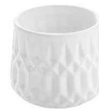
C132-5 conf. 12 pz master 144 pz h mm. 70 - Ø 80 interno h mm. 55 - Ø 60