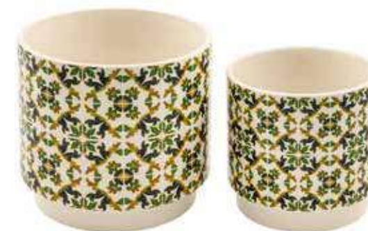
ML-16SET conf. 6 set master 24 set h mm. 125 - Ø 125 - h 100 - Ø 100 interno h mm. 115 - Ø 115 - h 90 - Ø 90