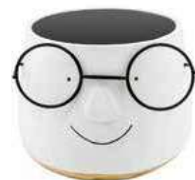
VDE-49A conf. 6 pz master 18 pz h mm. 100 - Ø 125 interno h mm. 90 - Ø 95