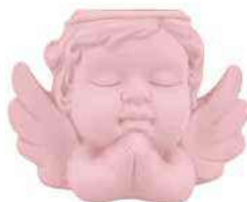
VDE-50-RS conf. 4 pz master 48 pz h mm. 90 x 75 x 125 interno Ø 40