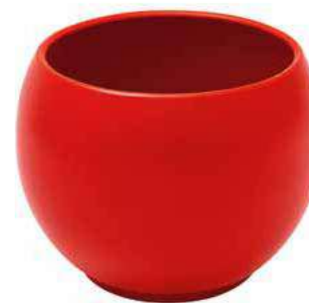
KE6-D150-RO conf. 5 pz pallet 510 pz h mm. 130 - Ø 150 interno h mm. 110 - Ø 125