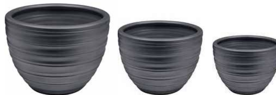
AR-03-SET-GR-PERL conf. 1 set h mm. 400 - Ø 500 - h 310 - Ø 420 - h 260 - Ø 340 interno h mm. 320 - Ø 455 - h 290 - Ø 360 - h 250 - Ø 290