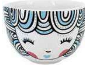
VDE-37 conf. 24 pz master 96 pz h mm. 50 - Ø 75 interno Ø 65