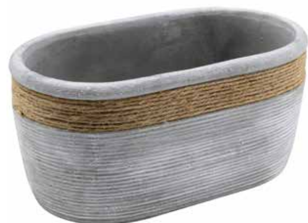
RC-02 conf. 4 pz h mm. 120 x 140 x 245 interno h mm. 110 x 120 x 235