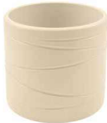
KE13-D180-AV conf. 4 pz pallet 312 pz h mm. 175 - Ø 185 interno h mm. 160 - Ø 170