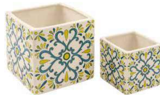
ML-22SET conf. 6 set master 24 set h mm. 120 x 120 x 120 - h 80 x 80 x 80 interno h mm. 110 x 110 x 110 - h 70 x 70 x 70