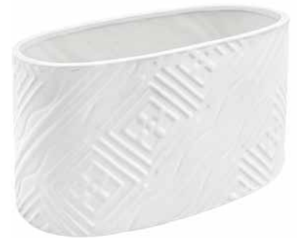
VDE-07 conf. 12 pz h mm. 140 x 140 x 260 interno h mm. 135 x 135 x 255