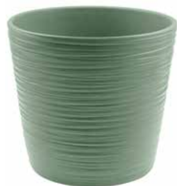
KE16-D210-VE conf. 1 pz pallet 264 pz h mm. 190 - Ø 210 interno h mm. 180 - Ø 170