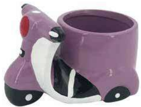
VDE-17 conf. 48 pz h mm. 78 x 128 x 80 interno h mm. 70 - Ø 90