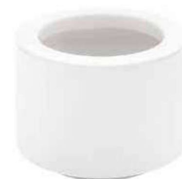
6427-BI conf. 4 pz h mm. 125 - Ø 170 interno h mm. 120 - Ø 120