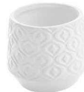
C842-5 conf. 12 pz master 144 pz h mm. 70 - Ø 82 interno h mm. 55 - Ø 60