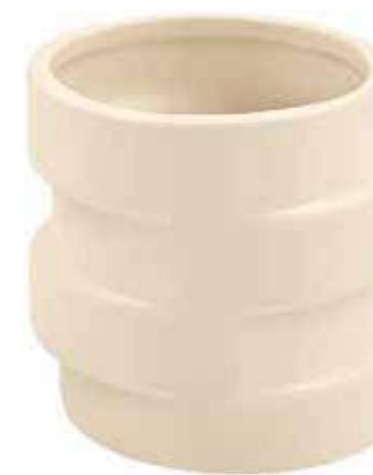
N352-5-AV conf. 12 pz h mm. 82 - Ø 73 interno h mm. 77 - Ø 68