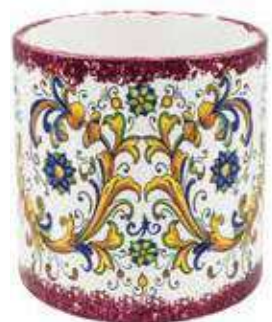
CD-18-PR conf. 1 pz h mm. 195 - Ø 180 interno h mm. 180 - Ø 165