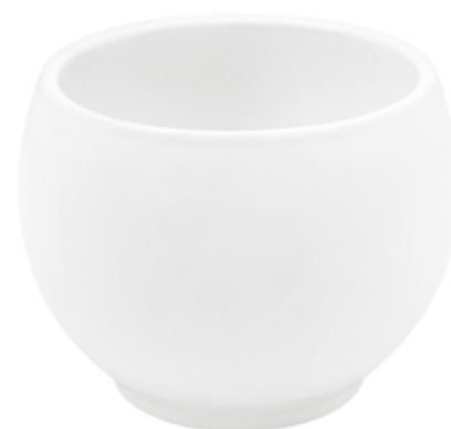
KE6-D130-BI conf. 8 pz pallet 960 pz h mm. 105 - Ø 130 interno h mm. 90 - Ø 103