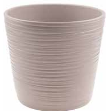
KE16-D210-TO conf. 1 pz pallet 264 pz h mm. 190 - Ø 210 interno h mm. 180 - Ø 170