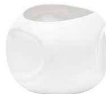
5910-2-BI conf. 2 pz h mm. 160 - Ø 220 interno h mm. 155 - Ø 150