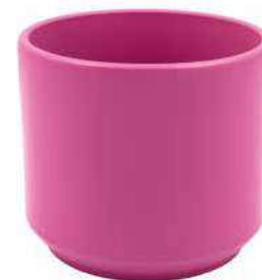
KE12-D190-FC conf. 4 pz pallet 288 pz h mm. 170 - Ø 190 interno h mm. 160 - Ø 175