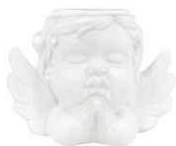
VDE-50 conf. 4 pz master 48 pz h mm. 90 x 75 x 125 interno Ø 40