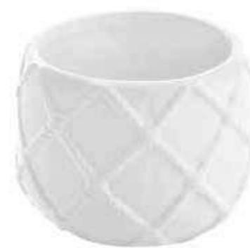
G132-5 conf. 12 pz master 144 pz h mm. 65 - Ø 85 interno h mm. 52 - Ø 70