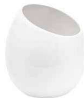
5639-1-BI conf. 4 pz h mm. 180 - Ø 150 interno h mm. 120 - Ø 130