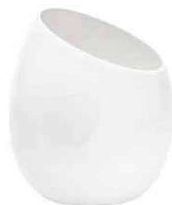
5639-3-BI conf. 3 pz h mm. 260 - Ø 200 interno h mm. 170 - Ø 185