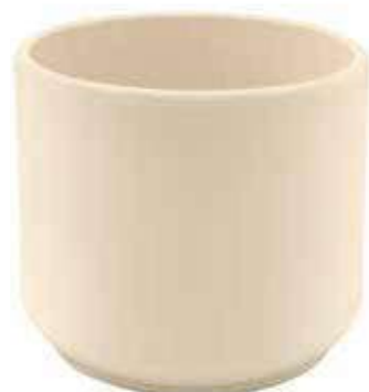
KE12-D170-AV conf. 4 pz pallet 336 pz h mm. 150 - Ø 170 interno h mm. 140 - Ø 150