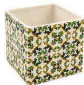
ML-17 conf. 6 pz master 108 pz h mm. 60 x 60 x 60 interno h mm. 50 x 50 x 50