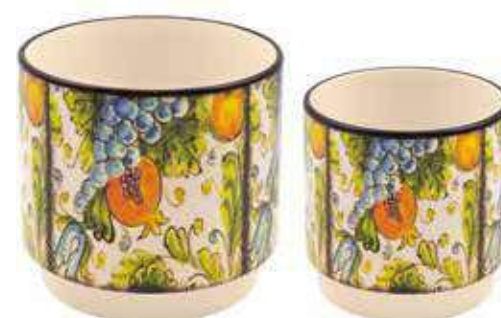
ML-32SET conf. 6 set master 24 set h mm. 125 - Ø 125 - h 100 - Ø 100 interno h mm. 115 - Ø 115 - h 90 - Ø 90