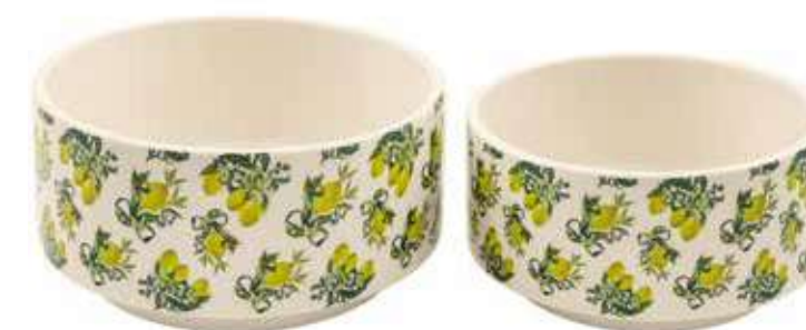
ML-12SET conf. 4 set master 16 set h mm. 95 - Ø 185 - h 85 - Ø 160 interno h mm. 85 - Ø 170 - h 80 - Ø 150