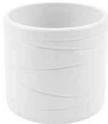
KE13-D180-BI conf. 4 pz pallet 312 pz h mm. 175 - Ø 185 interno h mm. 160 - Ø 170