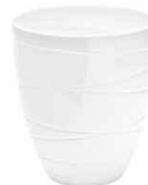
5326-2-BI conf. 3 pz h mm. 250 - Ø 220 interno h mm. 245 - Ø 210