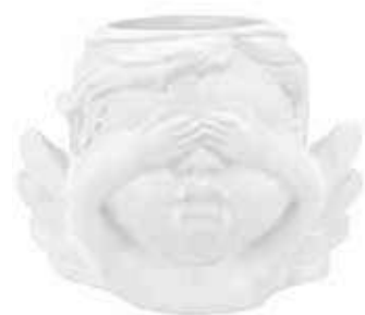
VDE-50A conf. 4 pz master 48 pz h mm. 85 x 75 x 117 interno Ø 40