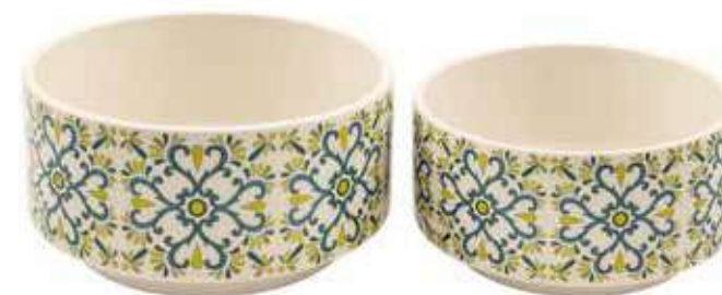
ML-21SET conf. 4 set master 16 set h mm. 95 - Ø 185 - h 85 - Ø 160 interno h mm. 85 - Ø 170 - h 80 - Ø 150