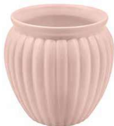
VS-02-RS conf. 12 pz pallet 504 pz h mm. 140 - Ø 125 interno h mm. 120 - Ø 107