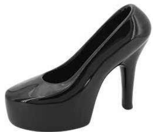
VDE-29 conf. 1 pz master 16 pz h mm. 147 x 195 x 80 interno Ø 75