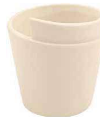
Q042-5-AV conf. 12 pz h mm. 70 - Ø 88 interno h mm. 65 - Ø 80