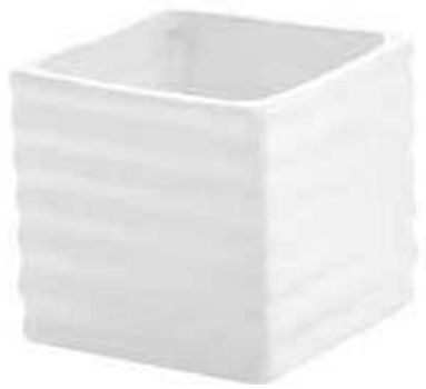
2022 conf. 12 pz master 120 pz h mm. 70 x 75 x 75 interno h mm. 52 x 63 x 63