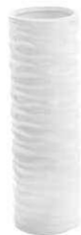
3219 conf. 6 pz master 72 pz h mm. 180 - Ø 55 interno h mm. 162 - Ø 45