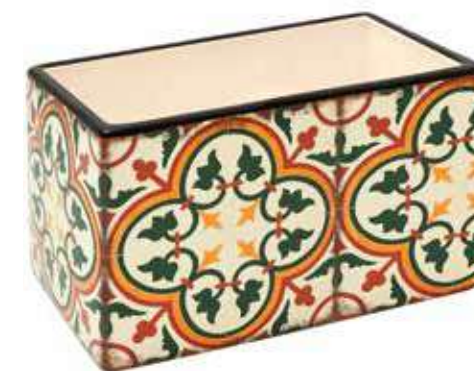
ML-43 conf. 6 pz master 24 pz h mm. 90 x 90 x 145 interno h mm. 80 x 80 x 135