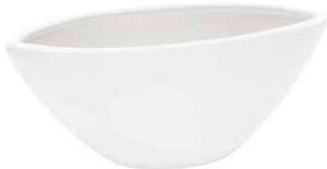
4683-1-BI conf. 6 pz h mm. 110 x 255 x 130 interno h mm. 100 x 230 x 120