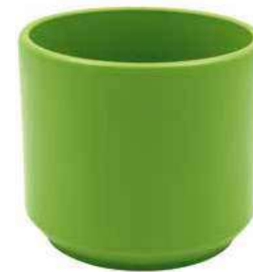
KE12-D190-VE conf. 4 pz pallet 288 pz h mm. 170 - Ø 190 interno h mm. 160 - Ø 175