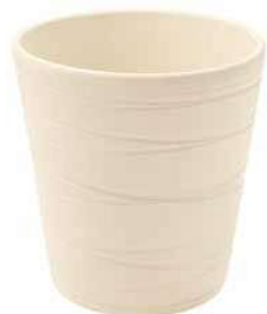
KE7-D130-AV conf. 9 pz pallet 864 pz h mm. 140 - Ø 130 interno h mm. 135 - Ø 120