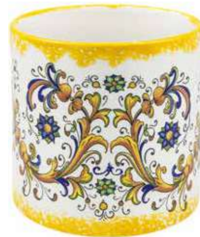
CD-15-GL conf. 1 pz h mm. 160 - Ø 150 interno h mm. 143 - Ø 140