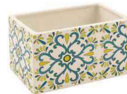
ML-27 conf. 6 pz master 24 pz h mm. 90 x 90 x 145 interno h mm. 80 x 80 x 135