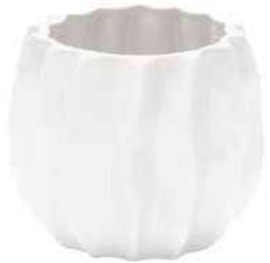
5690-0-BI conf. 4 pz h mm. 140 - Ø 160 interno h mm. 130 - Ø 110