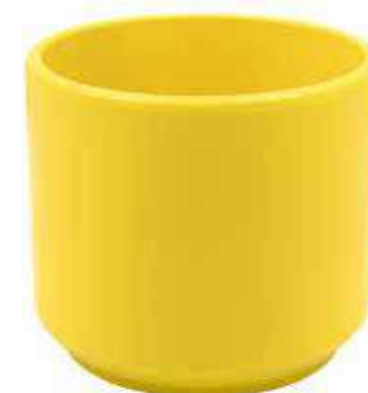
KE12-D190-GL conf. 4 pz pallet 288 pz h mm. 170 - Ø 190 interno h mm. 160 - Ø 175