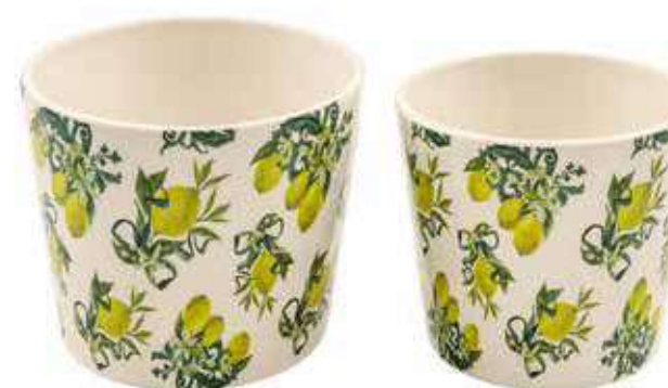
ML-15SET conf. 6 set master 18 set h mm. 125 - Ø 145 - h 110 - Ø 120 interno h mm. 120 - Ø 140 - h 105 - Ø 115