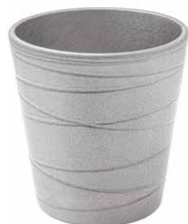
KE7-D130-ARG conf. 9 pz pallet 864 pz h mm. 140 - Ø 130 interno h mm. 135 - Ø 120