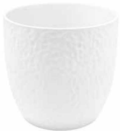
KC049-024-BI conf. 1 pz h mm. 230 - Ø 240 interno h mm. 225 - Ø 230