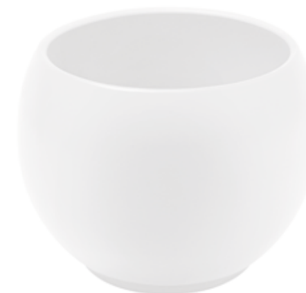
KE6-D150-BI conf. 5 pz pallet 510 pz h mm. 130 - Ø 150 interno h mm. 110 - Ø 125