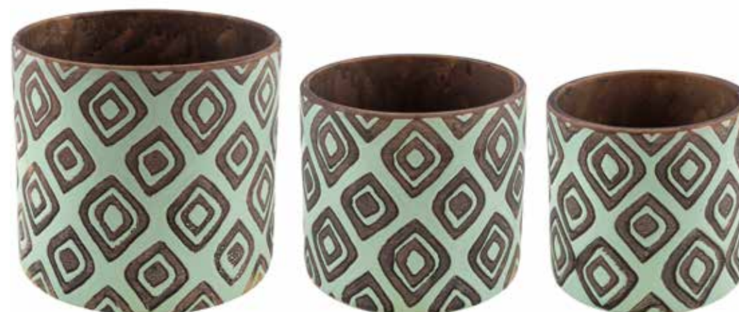
KE15-VE-SET conf. 4 set pallet 192 set h mm. 172 - Ø 190 - h 140 - Ø 155 - h 130 - Ø 140 interno h mm. 160 - Ø 170 - h 125 - Ø 140 - h 115 - Ø 123