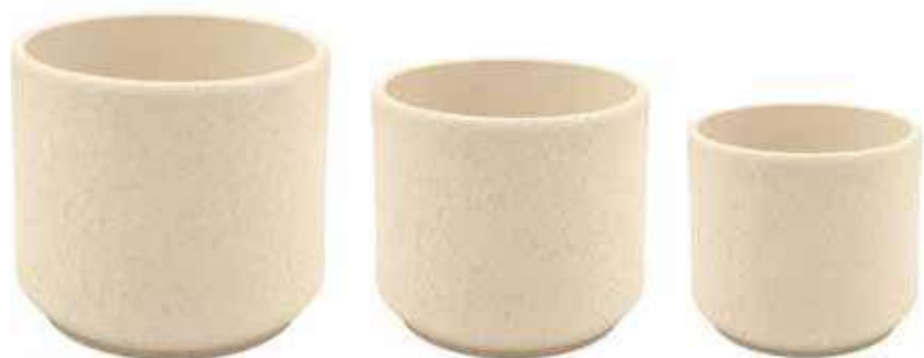
KE11-AV-SET conf. 4 set pallet 192 set h mm. 160 - Ø 190 - h 120 - Ø 150 - h 100 - Ø 120 interno h mm. 150 - Ø 175 - h 110 - Ø 140 - h 95 - Ø 105