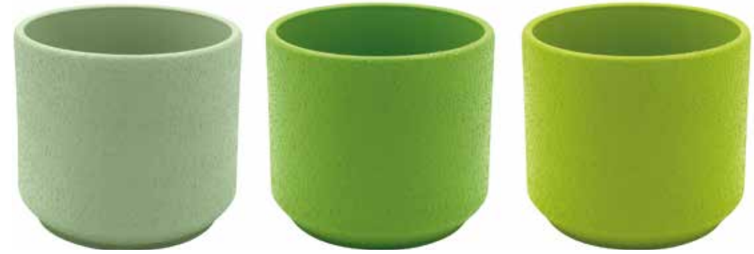
KE10-COL2 conf. 1 set da 12 pz pallet 168 set h mm. 95 - Ø 100 interno h mm. 80 - Ø 85