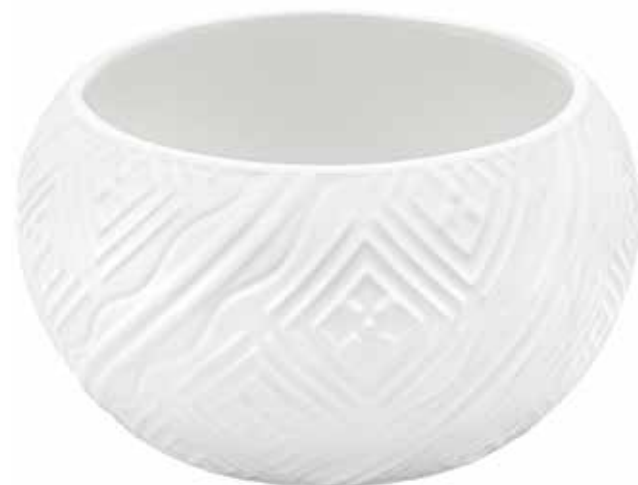
VDE-04 conf. 24 pz h mm. 140 - Ø 290 interno h mm. 130 - Ø 280