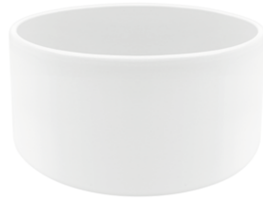
C-24-BI conf. 1 pz h mm. 145 - Ø 250 interno h mm. 135 - Ø 238