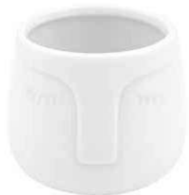
A832-5-BI conf. 12 pz h mm. 70 - Ø 84 interno h mm. 65 - Ø 80