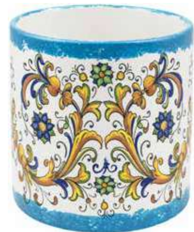
CD-15-BL conf. 1 pz h mm. 160 - Ø 150 interno h mm. 143 - Ø 140