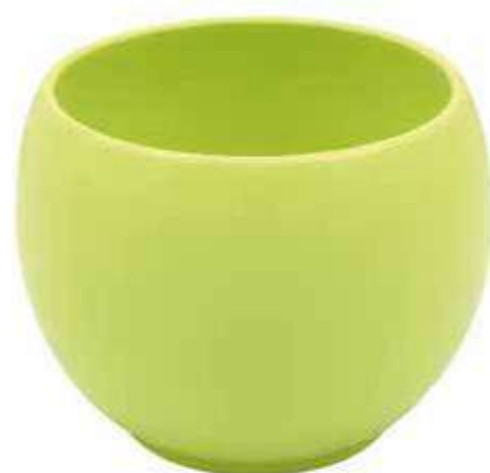
KE6-D150-VM conf. 5 pz pallet 510 pz h mm. 130 - Ø 150 interno h mm. 110 - Ø 125