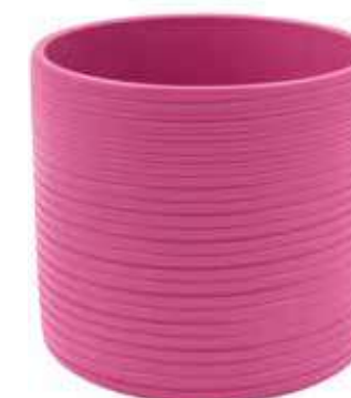
KE1-D135-FC conf. 6 pz pallet 612 pz h mm. 130 - Ø 135 interno h mm. 115 - Ø 120