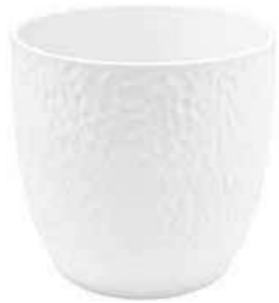
KC049-019-BI conf. 1 pz h mm. 180 - Ø 190 interno h mm. 175 - Ø 180