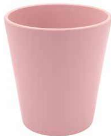
KE5-D130-RS conf. 9 pz pallet 864 pz h mm. 140 - Ø 130 interno h mm. 135 - Ø 118