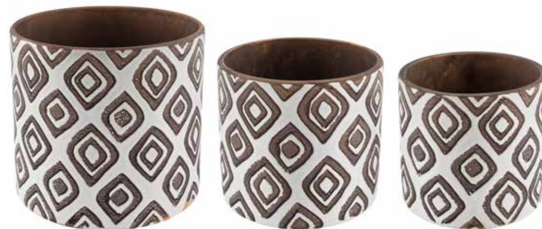
KE15-BI-SET conf. 4 set pallet 192 set h mm. 172 - Ø 190 - h 140 - Ø 155 - h 130 - Ø 140 interno h mm. 160 - Ø 170 - h 125 - Ø 140 - h 115 - Ø 123