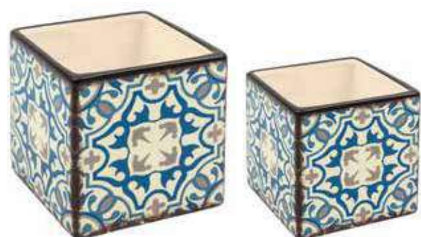
ML-36SET conf. 6 set master 18 set h mm. 135 x 135 x 135 - h 100 x 100 x 100 interno h mm. 125 x 125 x 125 - h 90 x 90 x 90