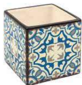
ML-40 conf. 6 pz master 108 pz h mm. 60 x 60 x 60 interno h mm. 50 x 50 x 50