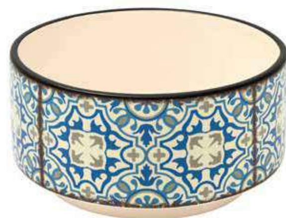
ML-42 conf. 4 pz master 8 pz h mm. 145 - Ø 230 interno h mm. 135 - Ø 215