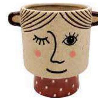
VDE-33 conf. 6 pz master 18 pz h mm. 130 x 105 x 142 interno Ø 85