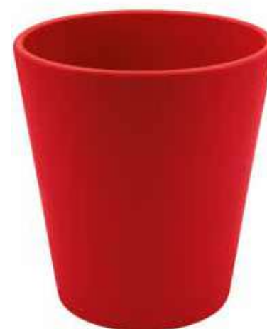
KE5-D130-RO conf. 9 pz pallet 864 pz h mm. 140 - Ø 130 interno h mm. 135 - Ø 118