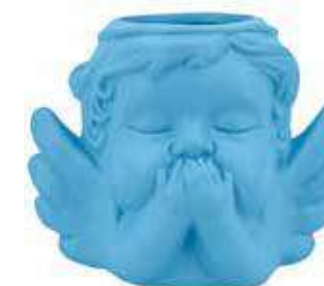
VDE-50C-CE conf. 4 pz master 48 pz h mm. 90 x 80 x 117 interno Ø 40