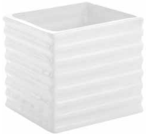
2022-B conf. 6 pz master 48 pz h mm. 120 x 120 x 120 interno h mm. 90 x 100 x 100