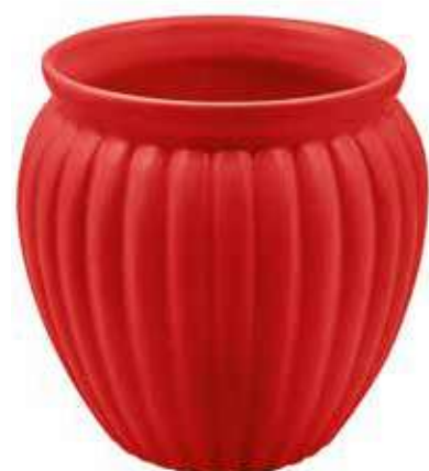
VS-02-RO conf. 12 pz pallet 504 pz h mm. 140 - Ø 125 interno h mm. 120 - Ø 107