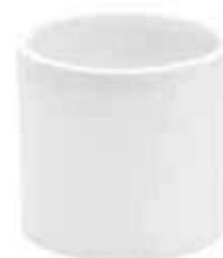
61-H60 conf. 12 pz master 144 pz h mm. 60 - Ø 65 interno h mm. 55 - Ø 55