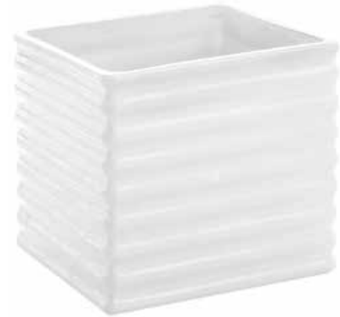
2022-C conf. 6 pz master 24 pz h mm. 140 x 140 x 140 interno h mm. 105 x 120 x 120