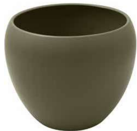
KE9-D270-OLIVA conf. 1 pz pallet 108 pz h mm. 230 - Ø 270 interno h mm. 210 - Ø 230