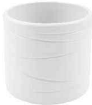
KE13-D150-BI conf. 5 pz pallet 480 pz h mm. 140 - Ø 155 interno h mm. 125 - Ø 140