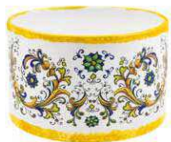
CD-26-GL conf. 1 pz h mm. 170 - Ø 260 interno h mm. 155 - Ø 245