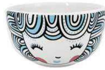
VDE-41 conf. 24 pz master 48 pz h mm. 60 - Ø 110 interno Ø 98