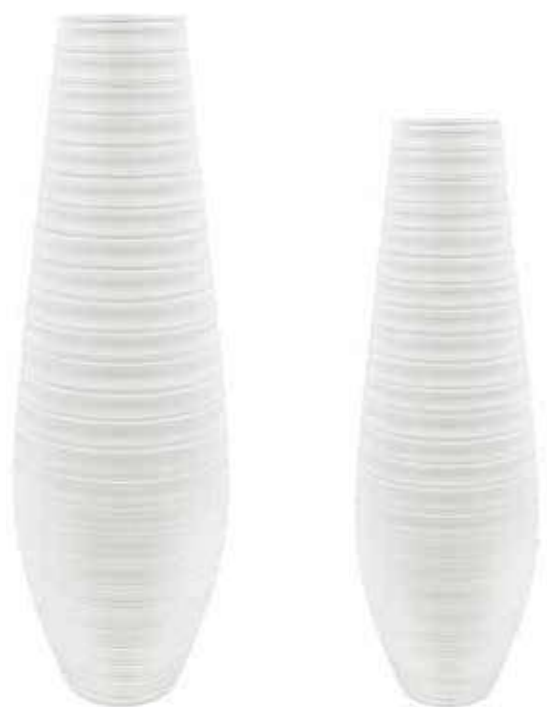
AR-07-BI conf. 1 pz h mm. 1200 - Ø 280 interno h mm. 1185 - Ø 150