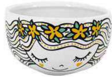
VDE-40 conf. 24 pz master 48 pz h mm. 60 - Ø 110 interno Ø 98