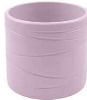
KE13-D180-LI conf. 4 pz pallet 312 pz h mm. 175 - Ø 185 interno h mm. 160 - Ø 170