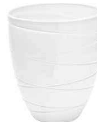
5326-3-BI conf. 2 pz h mm. 320 - Ø 280 interno h mm. 315 - Ø 275