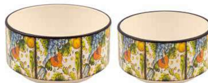
ML-28SET conf. 6 set master 16 set h mm. 95 - Ø 185 - h 85 - Ø 160 interno h mm. 85 - Ø 170 - h 80 - Ø 150