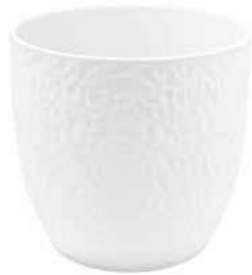
KC049-021-BI conf. 1 pz h mm. 200 - Ø 210 interno h mm. 195 - Ø 200