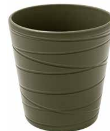
KE7-D130-OLIVA conf. 9 pz pallet 864 pz h mm. 140 - Ø 130 interno h mm. 135 - Ø 120