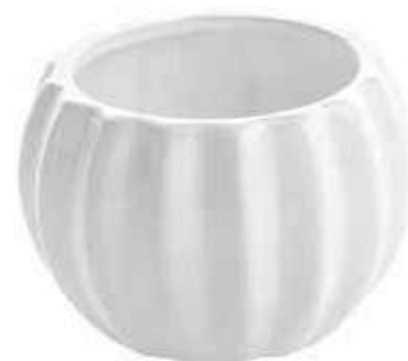
166 conf. 12 pz master 120 pz h mm. 60 - Ø 90 interno h mm. 48 - Ø 65