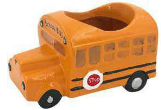
VDE-16 conf. 48 pz h mm. 75 x 135 x 80 interno h mm. 70 - Ø 75