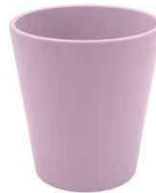
KE5-D100-LI conf. 9 pz pallet 1008 pz h mm. 130 - Ø 105 interno h mm. 95 - Ø 95