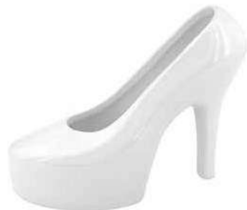
VDE-25 conf. 1 pz master 16 pz h mm. 147 x 195 x 80 interno Ø 75