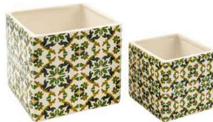
ML-14SET conf. 6 set master 18 set h mm. 135 x 135 x 135 - h 100 x 100 x 100 interno h mm. 125 x 125 x 125 - h 90 x 90 x 90