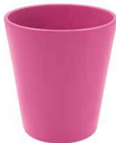
KE5-D130-FC conf. 9 pz pallet 864 pz h mm. 140 - Ø 130 interno h mm. 135 - Ø 118