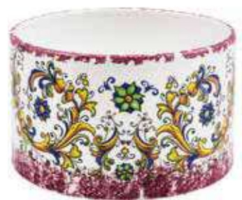
CD-26-PR conf. 1 pz h mm. 170 - Ø 260 interno h mm. 155 - Ø 245