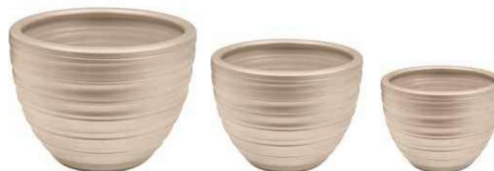
AR-03-SET-TO-PERL conf. 1 set h mm. 400 - Ø 500 - h 310 - Ø 420 - h 260 - Ø 340 interno h mm. 320 - Ø 455 - h 290 - Ø 360 - h 250 - Ø 290