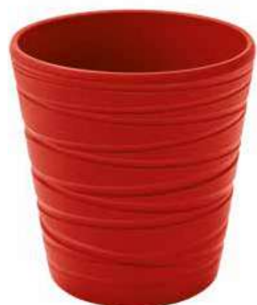
KE7-D130-RO conf. 9 pz pallet 864 pz h mm. 140 - Ø 130 interno h mm. 135 - Ø 120