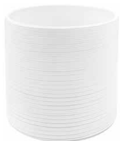
KE1-D180-BI conf. 4 pz pallet 312 pz h mm. 175 - Ø 185 interno h mm. 160 - Ø 170