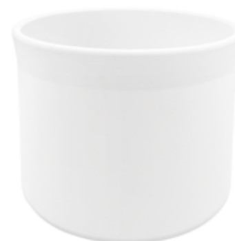
KC525-022-BI conf. 1 pz h mm. 190 - Ø 220 interno h mm. 175 - Ø 200