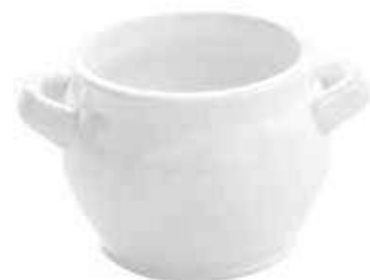
2133 conf. 12 pz master 120 pz h mm. 60 - Ø 80 interno h mm. 47 - Ø 64