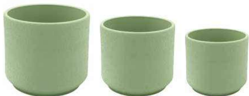
KE11-VM-SET conf. 4 set pallet 192 set h mm. 160 - Ø 190 - h 120 - Ø 150 - h 100 - Ø 120 interno h mm. 150 - Ø 175 - h 110 - Ø 140 - h 95 - Ø 105