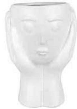
VDE-56 conf. 1 pz master 12 pz h mm. 185 x 154 x 160 interno Ø 83