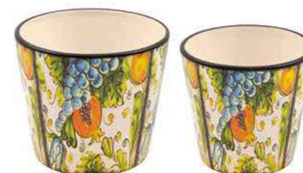
ML-31SET conf. 6 set master 18 set h mm. 125 - Ø 145 - h 110 - Ø 120 interno h mm. 120 - Ø 140 - h 105 - Ø 115