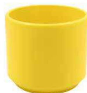
KE12-D150-GL conf. 5 pz pallet 480 pz h mm. 120 - Ø 150 interno h mm. 110 - Ø 135