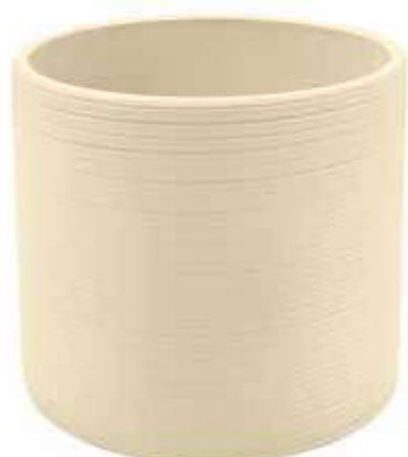
KE1-D150-AV conf. 5 pz pallet 480 pz h mm. 140 - Ø 155 interno h mm. 125 - Ø 140