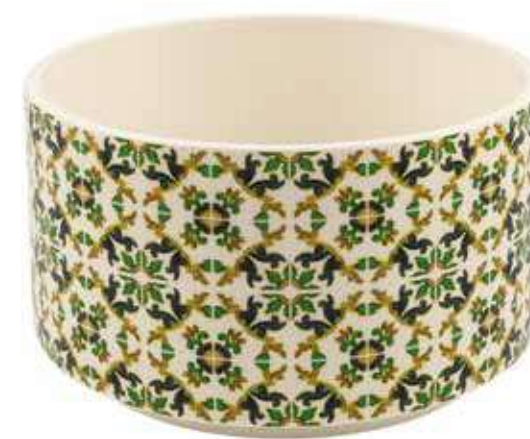
ML-19 conf. 4 pz master 8 pz h mm. 145 - Ø 230 interno h mm. 135 - Ø 215