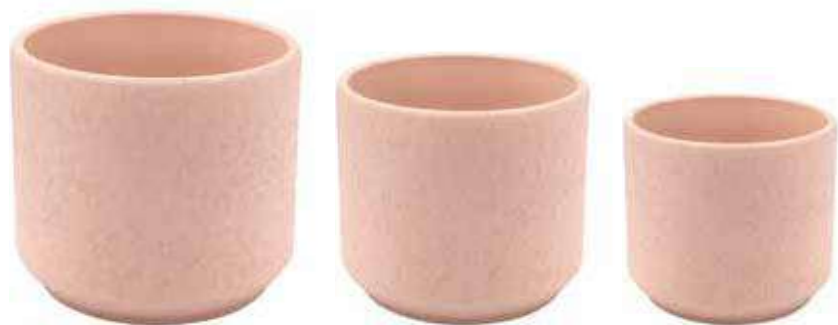
KE11-SA-SET conf. 4 set pallet 192 set h mm. 160 - Ø 190 - h 120 - Ø 150 - h 100 - Ø 120 interno h mm. 150 - Ø 175 - h 110 - Ø 140 - h 95 - Ø 105