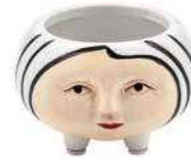
VDE-45 conf. 24 pz master 96 pz h mm. 50 - Ø 75 interno Ø 45