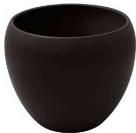
KE9-D270-NE conf. 1 pz pallet 108 pz h mm. 230 - Ø 270 interno h mm. 210 - Ø 230