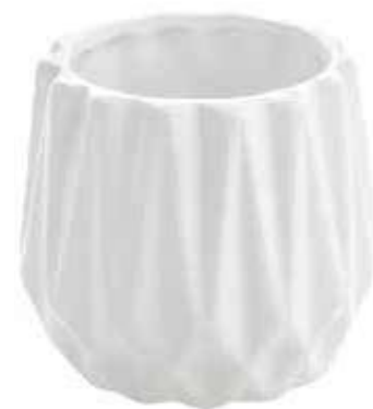
165 conf. 12 pz master 96 pz h mm. 80 - Ø 90 interno h mm. 65 - Ø 65