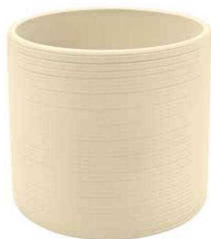
KE1-D180-AV conf. 4 pz pallet 312 pz h mm. 175 - Ø 185 interno h mm. 160 - Ø 170