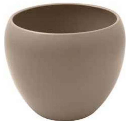
KE9-D270-FANGO conf. 1 pz pallet 108 pz h mm. 230 - Ø 270 interno h mm. 210 - Ø 230