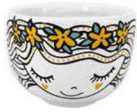
VDE-36 conf. 24 pz master 96 pz h mm. 50 - Ø 75 interno Ø 65