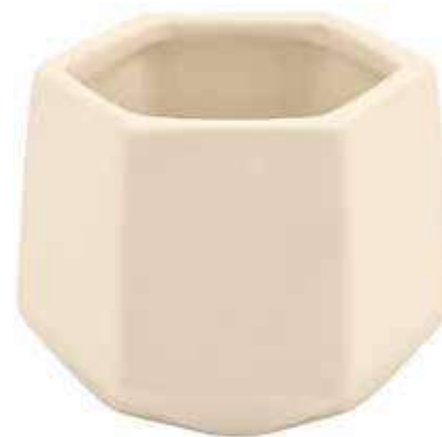
P042-5-AV conf. 12 pz h mm. 70 - Ø 84 interno h mm. 65 - Ø 80