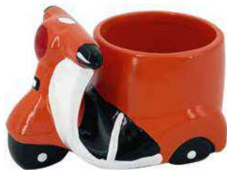
VDE-18 conf. 48 pz h mm. 78 x 128 x 80 interno h mm. 70 - Ø 90