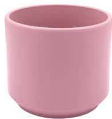
KE12-D190-RS conf. 4 pz pallet 288 pz h mm. 170 - Ø 190 interno h mm. 160 - Ø 175