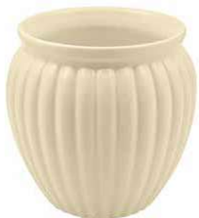
VS-02-AV conf. 12 pz pallet 504 pz h mm. 140 - Ø 125 interno h mm. 120 - Ø 107