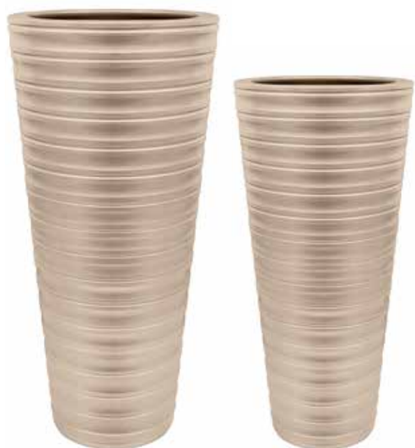
AR-02-TO-PERL conf. 1 pz h mm. 915 - Ø 360 interno h mm. 900 - Ø 280