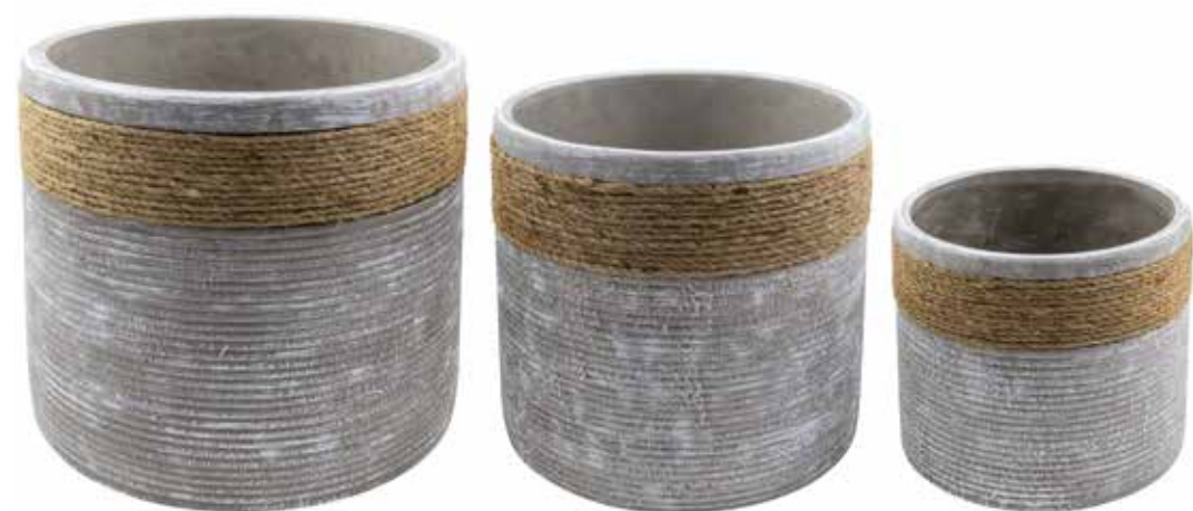
RC-04SET conf. 1 set h mm. 275 - Ø 310 - h 245 - Ø 250 - h 178 - Ø 193 interno h mm. 255 - Ø 265 - h 225 - Ø 223 - h 165 - Ø 172