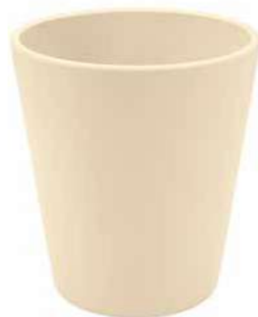
KE5-D130-AV conf. 9 pz pallet 864 pz h mm. 140 - Ø 130 interno h mm. 135 - Ø 118