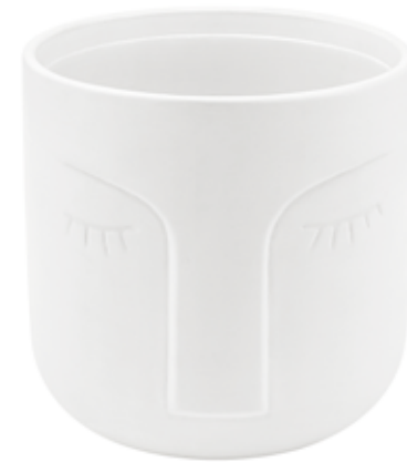
VS-01-BI conf. 1 pz master 12 pz pallet 652 pz h mm. 125 - Ø 125 interno Ø 114