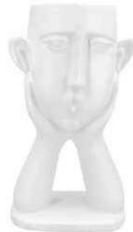
VDE-53 conf. 1 pz master 12 pz h mm. 285 x 123 x 162 interno Ø 90