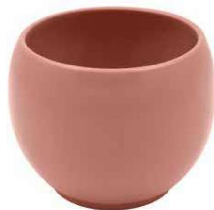
KE6-D150-RA conf. 5 pz pallet 510 pz h mm. 130 - Ø 150 interno h mm. 110 - Ø 125