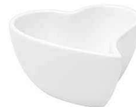
CR-02 conf. 12 pz master 36 pz h mm. 60 x 120 x 120 interno h mm. 50 x 110 x 110