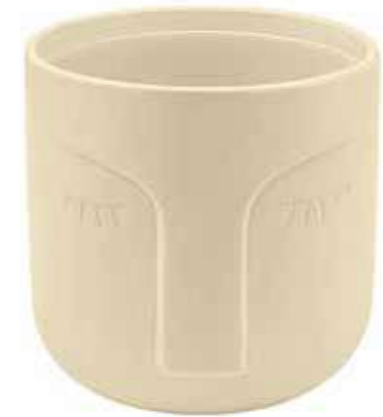
VS-01-AV conf. 1 pz master 12 pz pallet 652 pz h mm. 125 - Ø 125 interno Ø 114