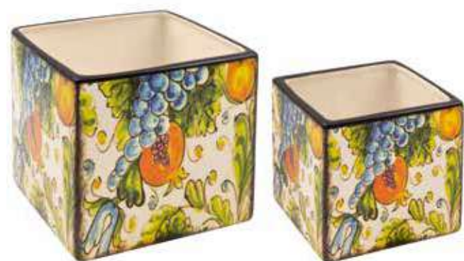
ML-30SET conf. 6 set master 18 set h mm. 135 x 135 x 135 - h 100 x 100 x 100 interno h mm. 125 x 125 x 125 - h 90 x 90 x 90