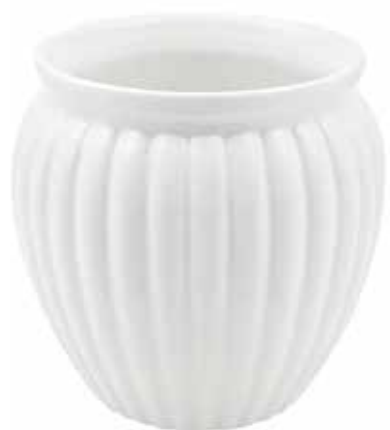
VS-02-BI conf. 12 pz pallet 504 pz h mm. 140 - Ø 125 interno h mm. 120 - Ø 107