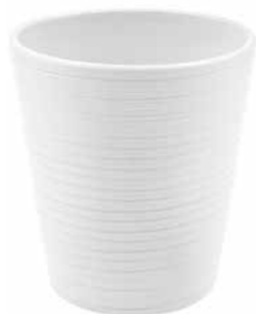
KE14-D130-BI conf. 9 pz pallet 864 pz h mm. 140 - Ø 130 interno h mm. 135 - Ø 123