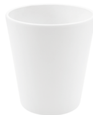
KE5-D100-BI conf. 9 pz pallet 1008 pz h mm. 130 - Ø 105 interno h mm. 95 - Ø 95