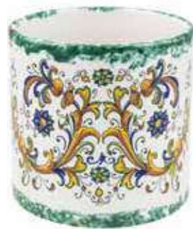
CD-18-VE conf. 1 pz h mm. 195 - Ø 180 interno h mm. 180 - Ø 165