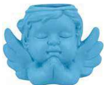
VDE-50-CE conf. 4 pz master 48 pz h mm. 90 x 75 x 125 interno Ø 40