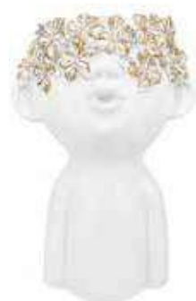
VDE-48A conf. 1 pz master 18 pz h mm. 180 x 75 x 120 interno h mm. 70- Ø 55