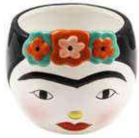
VDE-62 conf. 4 pz master 16 pz h mm. 120 x 140 x 140 interno Ø 105