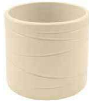
KE13-D135-AV conf. 6 pz pallet 612 pz h mm. 130 - Ø 135 interno h mm. 120 - Ø 120