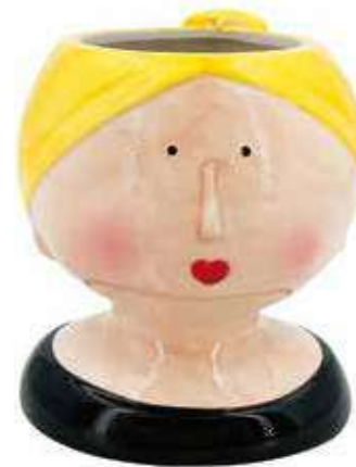
VDE-47 conf. 1 pz master 18 pz h mm. 160 - Ø 140 interno Ø 83