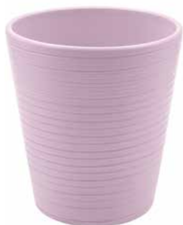
KE14-D130-LI conf. 9 pz pallet 864 pz h mm. 140 - Ø 130 interno h mm. 135 - Ø 123