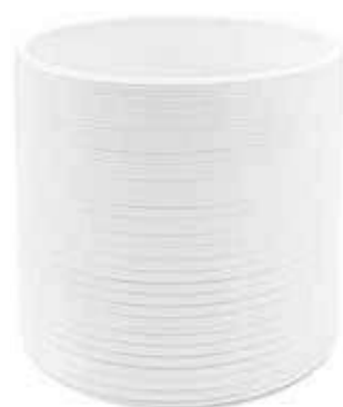
KE1-D135-BI conf. 6 pz pallet 612 pz h mm. 130 - Ø 135 interno h mm. 115 - Ø 120