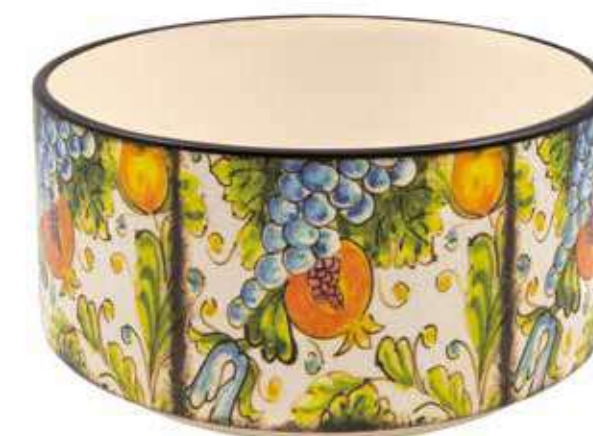
ML-33 conf. 4 pz master 8 pz h mm. 145 - Ø 230 interno h mm. 135 - Ø 215