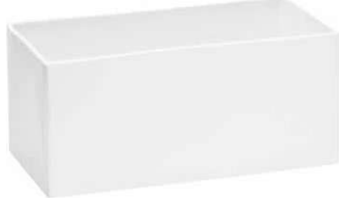
4186-BI conf. 4 pz h mm. 130 x 290 x 150 interno h mm. 125 x 280 x 135