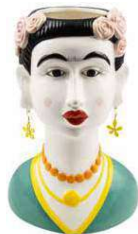
VDE-60 conf. 1 pz master 4 pz h mm. 320 x 210 x 170 interno Ø 95