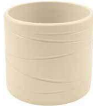
KE13-D150-AV conf. 5 pz pallet 480 pz h mm. 140 - Ø 155 interno h mm. 125 - Ø 140