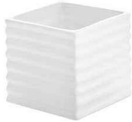
2022-A conf. 6 pz master 72 pz h mm. 100 x 100 x 100 interno h mm. 70 x 80 x 80