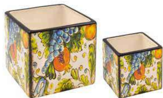
ML-29SET conf. 6 set master 24 set h mm. 120 x 120 x 120 - h 80 x 80 x 80 interno h mm. 110 x 110 x 110 - h 70 x 70 x 70