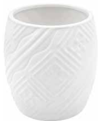
VDE-01 conf. 24 pz h mm. 140 - Ø 130 interno h mm. 130 - Ø 120