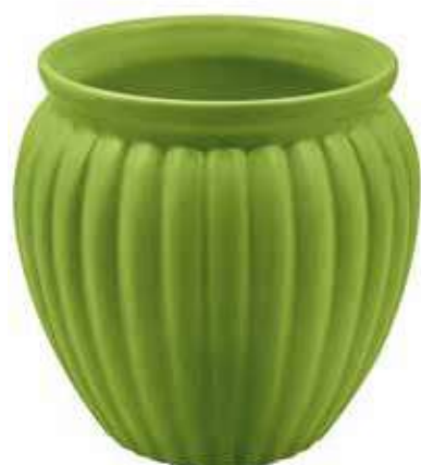
VS-02-VE conf. 12 pz pallet 504 pz h mm. 140 - Ø 125 interno h mm. 120 - Ø 107