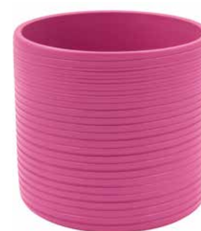
KE1-D180-FC conf. 4 pz pallet 312 pz h mm. 175 - Ø 185 interno h mm. 160 - Ø 170