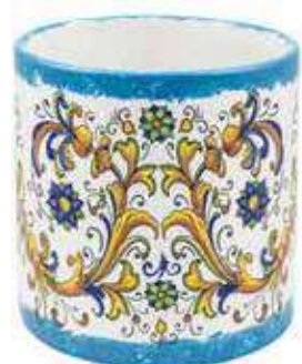
CD-18-BL conf. 1 pz h mm. 195 - Ø 180 interno h mm. 180 - Ø 165