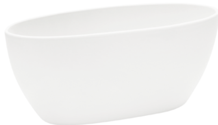
6150-W2-BI conf. 4 pz h mm. 150 x 345 x 140 interno h mm. 135 x 325 x 120