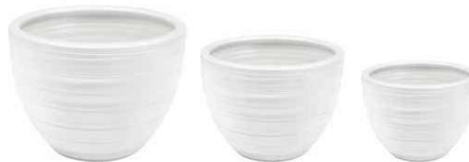
AR-03-SET-BI conf. 1 set h mm. 400 - Ø 500 - h 310 - Ø 420 - h 260 - Ø 340 interno h mm. 320 - Ø 455 - h 290 - Ø 360 - h 250 - Ø 290