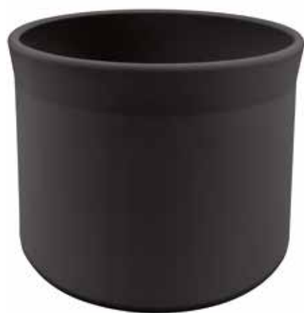
KC525-036-NE conf. 1 pz h mm. 310 - Ø 360 interno h mm. 300 - Ø 330