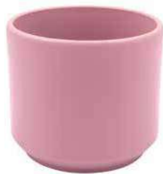
KE12-D170-RS conf. 4 pz pallet 336 pz h mm. 150 - Ø 170 interno h mm. 140 - Ø 150