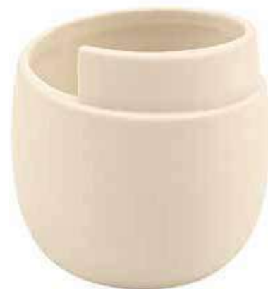
Q432-5-AV conf. 12 pz h mm. 70 - Ø 88 interno h mm. 65 - Ø 80