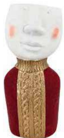
VDE-30 conf. 1 pz master 4 pz h mm. 330 x 140 x 150 interno h mm. 95- Ø 95