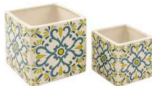
ML-23SET conf. 6 set master 18 set h mm. 135 x 135 x 135 - h 100 x 100 x 100 interno h mm. 125 x 125 x 125 - h 90 x 90 x 90