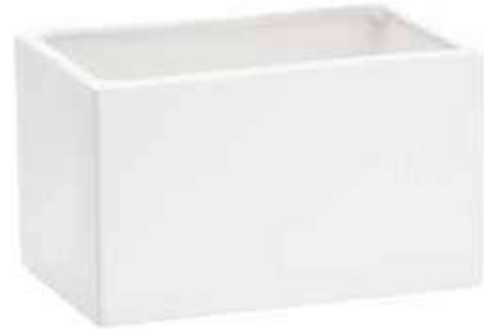
3365-1-BI conf. 6 pz h mm. 100 x 200 x 100 interno h mm. 95 x 190 x 95