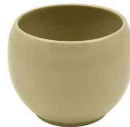
KE6-D150-SALVIA conf. 5 pz pallet 510 pz h mm. 130 - Ø 150 interno h mm. 110 - Ø 125