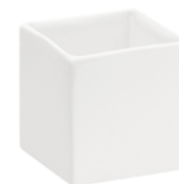
3363-0-BI conf. 4 pz h mm. 105 x 105 x 105 interno h mm. 95 x 90 x 90