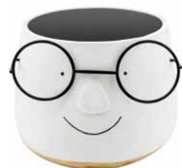
VDE-49C conf. 6 pz master 6 pz h mm. 160 - Ø 200 interno h mm. 140 - Ø 155