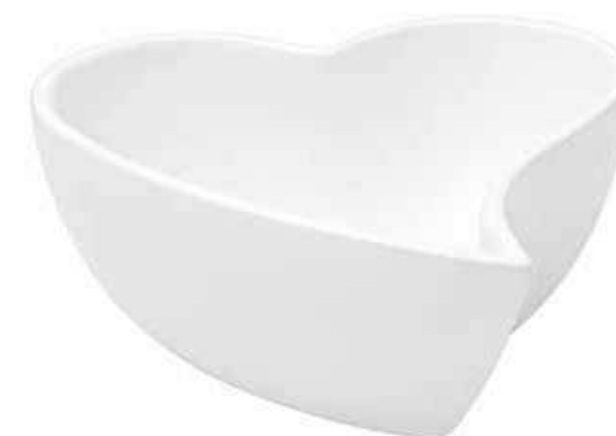
CR-04 conf. 6 pz master 24 pz h mm. 70 x 170 x 170 interno h mm. 60 x 160 x 160