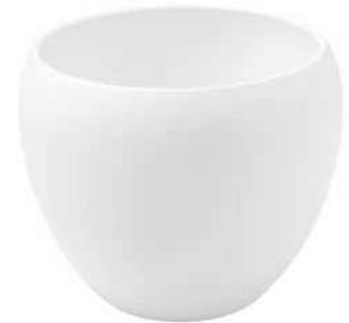
KE9-D270-BI conf. 1 pz pallet 108 pz h mm. 230 - Ø 270 interno h mm. 210 - Ø 230