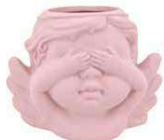
VDE-50A-RS conf. 4 pz master 48 pz h mm. 85 x 75 x 117 interno Ø 40